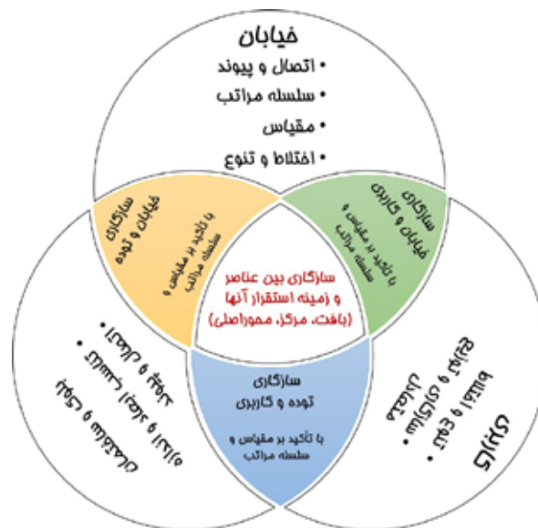
تصویر ۱. مدل مفهومی ارزیابی انسجام فرم (ارتباط عناصر و مراحل تحلیل از تک عنصر تا ترکیب دوتایی و سه تایی).

اصلی) جهت سنجش انسجام فرم، ارزیابی شود. همچنین پیشنهاد می‌شود واحدهای تحلیل پایه براساس چارچوب ارایه شده محلات شهری باشند چرا که در سنجش معیارهای انسجام، واحد شهری پایه بایستی دارای کلیت یک ساختار از جمله بافت، مرکز و محورهای اصلی باشد تا سه عنصر مورد