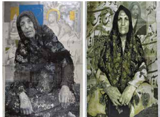
تصویر ۱۴. مادروخواهر (از مجموعه تروریست)، اثر خسرو حسن‌زاده، سیلک‌اسکرین با اکریلیک روی بوم، ۲۰۰۴ میلادی. ابعاد تصویر راست: ۳۰۸*۲۰۴. ابعاد تصویر چپ: ۳۰۰*۲۱۷ سانتیمتر.

جالب توجه باشد، اما امید به تأثیر اجتماعی گسترده‌تر از جمله تقابل یا به‌چالش‌گرفتن نگاه بیننده‌ای که با ذهن آکنده از پیش‌فرض‌ها با مردم شرق روبرو می‌شود، در توان چنین رویکردی به هنر نیست. در نهایت، ضعف نقادانه در روندی معکوس موجب می‌شود محتوای موردنقد در قالب‌هایی جدیدتر و خوش‌نماتر تولید شود. شادی قدیریان با عکاسی در فضای خانگی یا استودیو، در رویکردی به‌مراتب ضعیف‌تر که بر فرمولی ابتدایی از هم‌نشینی تقابل‌برانگیز زن و اشیاء نمادین بنا شده است، تلاش دارد محدودیت‌های اجتماعی زن ایرانی و تنش‌های حاصل از رویارویی سنت و مدرنیته را برجسته سازد (تصویر ۱۹).