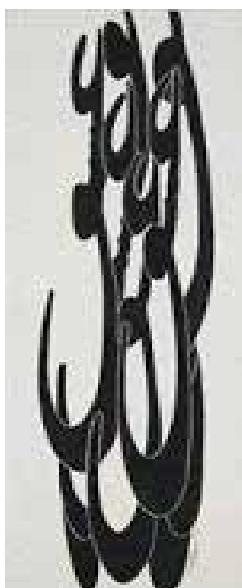
تصویر ۶. عشق، نصرالله افجهای، رنگ‌وروغن روی بوم، ۱۹۸۴ میلادی. ابعاد: ۱۵۰*۵۰ سانتیمتر.