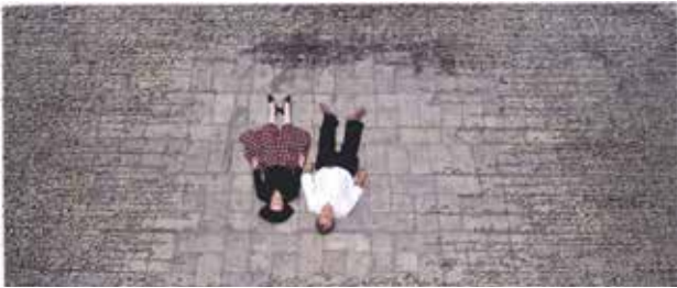
تصویر ۱۷. مونس و مرد انقلابی (از مجموعه زنان بدون مردان)، اثر شیرین نشاط، نوشته جوهری روی C-print، 2008 میلادی. ابعاد: ۱۳۸.۴*۲۴۳.۸ سانتیمتر.