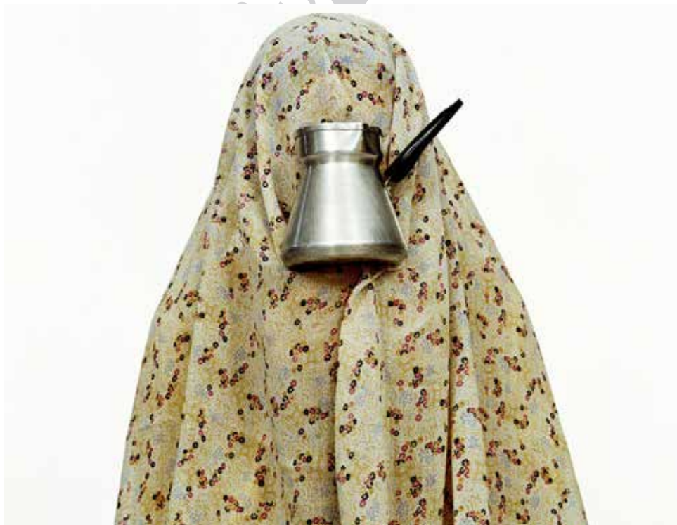
تصویر ۱۹. #۱ (از مجموعه مثل هرروز)، اثر شادی قدیریان، C-print، 2000 میلادی. ابعاد: ۵۰*۵۰ سانتیمتر.