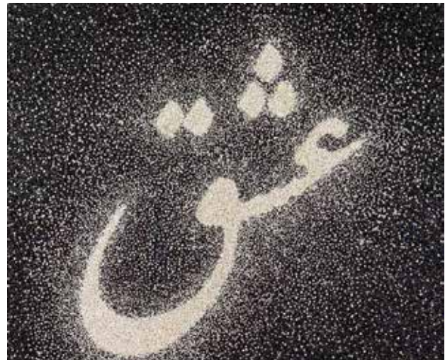
تصویر ۱۲. عشق، اثر فرهاد مشیری، کریستال سواروسکی، پولک و سنگ در ترکیب با اکریلیک روی بوم (سوارشده بر تخته)، ۲۰۰۷ میلادی. ابعاد: ۱۵۵*۱۷۶.

افشین پیرهاشمی، رکنی حائری‌زاده، شادی قدیریان و سارا رهبر شاخص‌تر هستند. «به نظر می‌رسد شیرین نشاط که از ۱۳۵۳ در نیویورک به زندگی و کار مشغول بوده است، شناخته‌شده‌ترین هنرمند ایرانی در غرب باشد. اغلب آثار او بر اساس موضوعاتی مبتنی بر تقابل‌های دوتایی مردان و زنان، امر مقدس و امر نامقدس، مهاجرت و تعلق شکل گرفته‌اند. نشاط همچنین به خاطر برخورد علنی و صریح خود با مسئله «ارتباط جنسیت‌ها» توجه گسترده‌ای را به خود معطوف داشته‌است» (کشمیرشکن، ۱۳۹۴: ۳۹۵). نشاط با بهره‌گیری از عکس و ویدئو از معدود هنرمندانی بود که رویکرد رسانه‌ای مؤثری در بیان مسائلی اساساً اجتماعی در پیش گرفت. هرچند آثار دهه ۹۰ میلادی او مورد توجه و ستایش قرار گرفت، اما چه در آن زمان و چه در قرن حاضر که نشاط مواضع پیشین خود را با اندک تغییری تکرار کرده است، داستان‌پردازی و روایات نیمه‌واقعی/خیالی او ارتباطی اندک با تجربه زیسته زنان ایرانی (در ابعاد گسترده) داشت. تأثیر و قدرت بیان رسانه مستندنگار طبعاً تجربه متفاوت و ملموس‌تری برای بیننده فراهم می‌کند اما تمرکز فزون از حد نشاط بر عناصر نمادین با معانی بسیار شخصی، مخاطب نوعی را که می‌تواند به وسعت جامعه درگیر با مسائل زنان باشد، از حوزه ارتباط دور نگه می‌دارد. در آثار پراحساس نشاط، بیان عاطفی عمیق، خرج سوژه‌ها و داستان‌هایی شده است که جایگاه و معنای تاریخی مشخص یا مناسبی ندارند. توصیف نشاط از زن، شمایل نوعی که از آن می‌سازد و نمادهایی که در جوار او می‌گنجانند، بیش از هر چیز یادآور کلیشه‌های شرق‌شناسانه ۲۶ است که زن اسرارآمیز شرقی را از نگاه