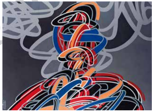
تصویر ۸. فیگور، اثر کوروش شیشه‌گران، اکریلیک روی بوم، ۲۰۱۴ میلادی. ابعاد: ۱۶۰*۲۰۰ سانتیمتر.

کمیک استریپ، آگهی‌های تبلیغاتی، بسته‌بندی و تصاویر تلویزیونی و سینما شمایل‌شناسی این هنر را پدید آوردند» (Chilvers & Glaves-Smith, 2009: 1552). ویژگی فرهنگ بصری عوام زرق‌وبرق، ابتذال، پیش‌پاافتادگی یا به اصطلاح کیفیت «کیچ» آن بود که در تقابل با فرهنگ فاخر نخبگان پنداشته می‌شد. پاپ‌آرت به عنوان نمونه‌وارترین شکل پست‌مدرنیستی از بیان هنری (در رویکرد به فرهنگ عامه‌پسند و سلیقه کیچ) قصد داشت جدیت هنر فاخر را به سخره بگیرد؛ هر چند در نهایت به دلیل ضعف شیوه‌های نقادانه، تسلیم سرمایه‌داری متأخر شد و ارزش بازاری