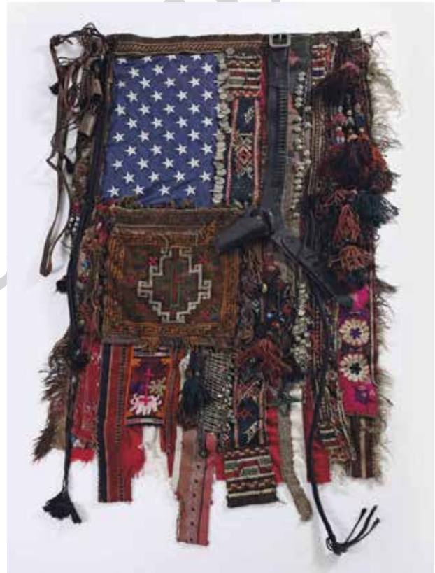
تصویر ۲۲. پرچم شماره ۱۵، اثر سارا رهبر، چیدمان از پارچه، کمر بند چرمی، قالی، منگوله، سکه و ستاره‌های فلزی، ۲۰۰۸ میلادی. ابعاد ۱۰۰*۲۰۳ سانتیمتر.

آنچه در آثار هنرمندان ما کالایی می‌شود، نمادها و نشانه‌های پرمعنا یا رویدادهای واقعی سیاسی و اجتماعی است که به تنش‌ها و آشفتگی‌های جامعه معاصر ایرانی ارجاع دارند. هنرمند با بیانی ناکارآمد موجب می‌شود ظرفیت‌های بیانی مجموعه‌های معنادار و ارزشمند مورد استفاده اش هدر رود و با