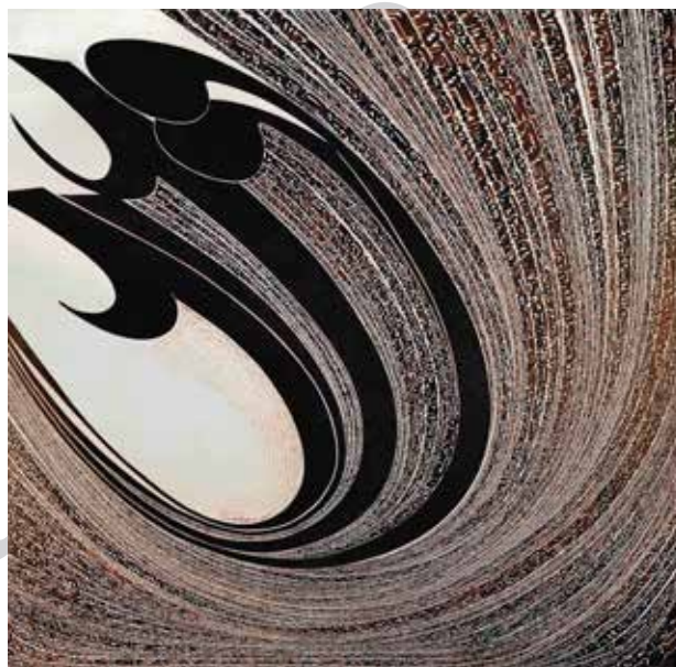
تصویر ۵. عشق، اثر نصرالله افجهای، اکریلیک روی بوم، ۲۰۱۰ میلادی. ابعاد: ۲۰۰*۲۰۰ سانتیمتر.

سلطه‌گرانه پیشنهاد می‌کند، در عرصه هنر عملاً بدل به نظریه‌ای تزیینی شد که به گونه‌ای متناقض، اگزوتیسم روزآمد و تازه‌تری تولید می‌کند. نشانه‌های فرهنگی یا ملیتی که از محتوا و زمینه متعارف خود جدا شده‌اند و دلالت آنها فراتر از تأثیر بر فعل‌وانفعالات فرمی و صوری نمی‌رود، چگونه می‌توانند تصور از «دیگری» را عملاً ساختارشکنی کنند؟ چگونه می‌توان از تصویر جدید که تنها ظاهر خود را عوض کرده است، برای مقاصد سلطه بهره نبرد؟ شمایل تازه چگونه جایگاه نابرابر حاشیه و مرکز را واقعاً تغییر خواهد داد؟ اشیاء چشمگیر و زیبایی که هنرمندان معاصر ایرانی از ترکیب هویت‌های (پیش‌تر متقابل) شرقی و غربی تولید می‌کنند، بی آنکه پیشفرض‌های ناعادلانه را به نحو اثرگذاری به چالش گیرند، تنها مشتری پایدار خود را در