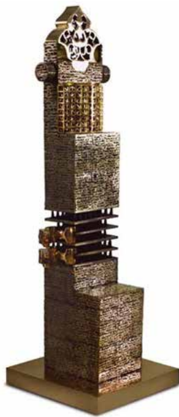
تصویر ۲. شاعر و قفس، اثر پرویز تناولی، جنس برنز، ۲۰۰۸ میلادی. ارتفاع: ۱۵۱ سانتیمتر.