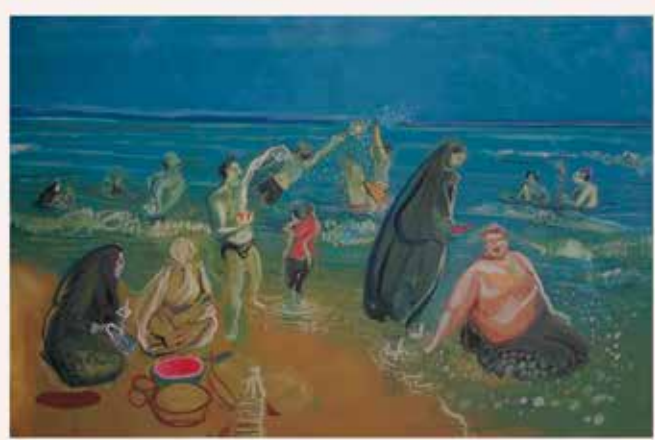
تصویر ۲۰. شمال، اثر رکنی حائری‌زاده، نقاشی روی بوم دولته‌ای، ۲۰۰۸ میلادی. ابعاد هر پانل: ۲۰۰*۳۰۰ سانتیمتر.