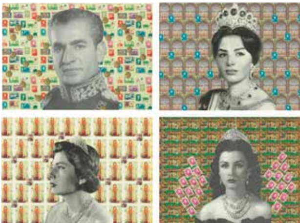
تصویر ۱۵. شاه و سه ملکه‌اش، اثر افسون، فوتوکلاژ چاپ شده روی کاغذ، ۲۰۰۹ میلادی. ابعاد مجموع چهارعکس: ۱۶۴*۵۸ سانتیمتر.