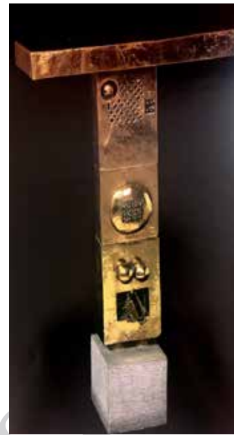
تصویر ۱. شاعر و قفس و بلبل، اثر پرویز تناولی، جنس برنز، ۱۳۴۹ شمسی. ارتفاع ۹۲ سانتیمتر. مأخذ: کشمیرشکن، ۱۳۹۴: ۱۱۱.

بازی زیباشناسانه فرو می‌کاهد، مورد حمله قرار می‌دهد» (ایگلتن، ۱۳۸۳: ۴۵). فرمالیسم ایرانی برای معین کردن بافت منطقه‌ای، نشانه‌های خاص فرهنگی را دستمایه قرار می‌دهد؛ با توجه به اینکه فرم‌گرایی مستلزم به‌حاشیه‌راندن یا حذف محتواست، هویت فرهنگی بدل به آرایه‌ای سطحی می‌شود که تنها به عنوان افزونه‌ای تمایزبخش، هویت فرهنگی-ملیتی «کالا» را تغییر می‌دهد. گرایش‌های فرمالیستی جدیدتر، حتی در رویکردی پسامدرنیستی نیز از ایجاد تحول واقعی در ماهیت اجزای متکثری که به ساختار تصویر شکل می‌دهد، ناتوانند. نمایندگان این رویکرد، عمدتاً به «واسازی» هویت‌های شرقی و غربی در آثارشان شهرت یافته‌اند. رضا درخشانی در تابلوهایی پُرکار با گیرایی بصری عمیق، موضوعاتی برگرفته از ادبیات و نگارگری سنتی ایران را (صحنه‌های شکار و بزم، انار، باغ ایرانی، خوشنویسی و ...) در سبک اجرایی اکسپرسیونیسم انتزاعی به نمایش می‌گذارد (تصویر ۱۰). رویکرد مشابهی را علی بنی‌صدر در «تلفیق فضای نگارگری سنتی با سبک هیرونی موس بوش» (هنرمند اروپایی قرن ۱۵) به نمایش می‌گذارد (Millet, 2016)؛ (تصویر ۱۱). ساختارشکنی در کار این هنرمندان چیزی بیش از ترکیب زبان تصویری شرق و غرب نیست. گرایش به هم‌آمیزی شرقی-غربی، از مشغولیت‌های هنرمندان معناگرایی چون آیدین آغداشلو و بسیاری از هنرمندان جوان‌تر که از دغدغه‌های فرمی فراتر رفته‌اند نیز هست. این هم‌آمیزی عموماً مصداقی از