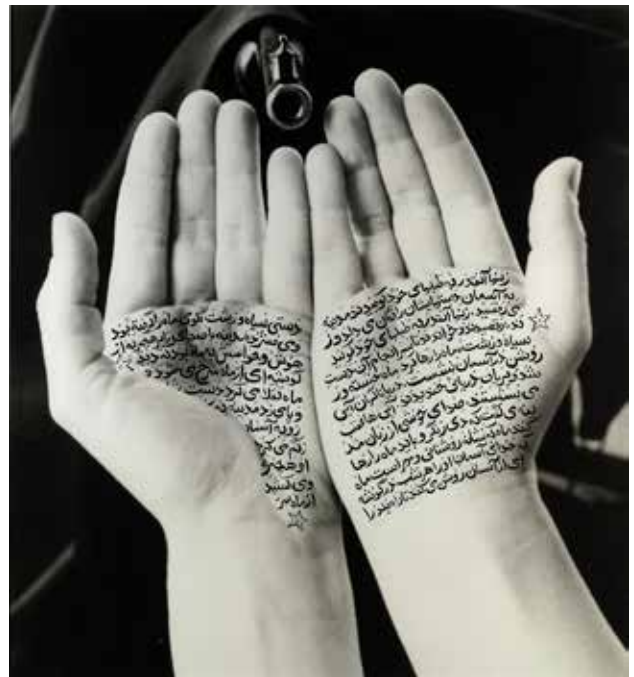
تصویر ۱۶. متولیان انقلاب (از مجموعه زنان الله)، اثر شیرین نشاط، نوشته‌های جوهری بر چاپ نقره ژلاتینی. ابعاد: ۱۱۰*۹۹.۷ سانتیمتر.