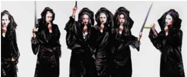
تصویر ۱۸. اغواء اثر افشین هاشمی، رنگ‌وروغن، ۲۰۱۰ میلادی. ابعاد: ۲۰۰*۲۹۸ سانتیمتر.