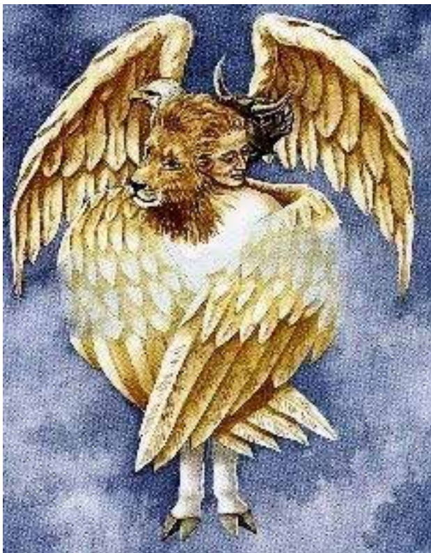
تصویر ۱. فرشته چهارسر در مکاشفه حزقیال نبی موزاییک رومی از کلیسای جامع سانتا ماریا.

در کتاب معراج‌نامه میرحیدر که سفر معراج پیامبر به آسمان‌ها را روایت می‌کند، پیامبر (ص) در یکی از طبقات آسمان پس از مواجه شدن با فرشته هفتادسر و فرشته عظیم،