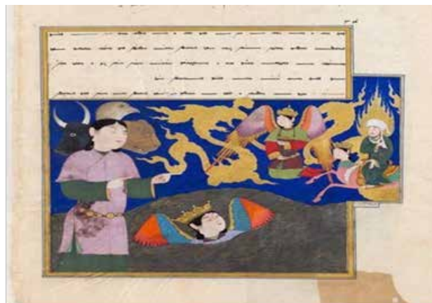
تصویر ۲. فرشته چهارسر در معراج‌نامه میرحیدر.

«ناس» در کتاب «تاریخ ادیان» در تعریف نجوم و تنجیم چنین می‌نویسد: «علم نجوم همان علم الهیئت، علم هیئت افلاک، علم هیئت عالم، علم الافلاک و علم صناعت نجوم است و امروز ما اصطلاح اخترشناسی را هم برای آن به کار می‌بریم اما تنجیم همان اخترگویی یا نجوم احکامی است که می‌گفتند ستاره‌ها در سرنوشت زمین اثر دارند و ما می‌خواهیم این اثر را کشف کنیم. در علم احکام نجوم را به تنجیم و علم‌النجامه نیز می‌خواندند و امروزه از اصطلاح اخترگویی برای آن استفاده می‌شود. در یک تعریف کلی از احکام نجوم می‌توان گفت: «هر آنچه که در عالم زیر فلک قمر رخ می‌دهد، ارتباط مستقیمی با اجرام آسمانی و حرکت آنها دارد» (ناس، ۱۳۵۴: ۲۴). تنجیم نوعی پیش‌گویی یا غیب‌گویی است؛ نوعی روش پیش‌بینی رویدادهای زمینی و انسانی براساس مشاهده و تفسیر اجرام آسمانی است که براساس موقعیت و ترکیب قرارگرفتن سیارات