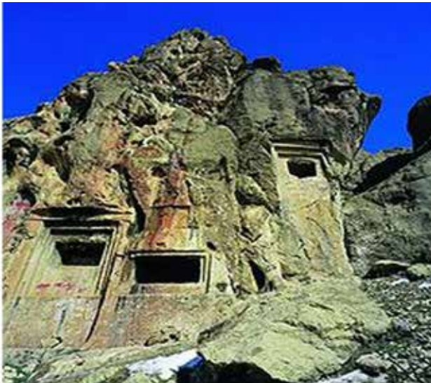
تصویر ۴. گوردخمه سکاوند.