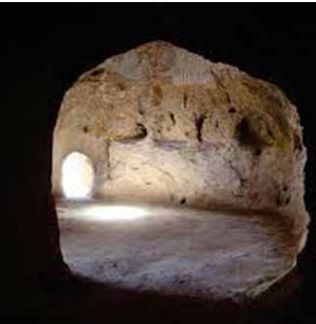
تصویر ۵. فضای داخلی معبد مهری مراغه.