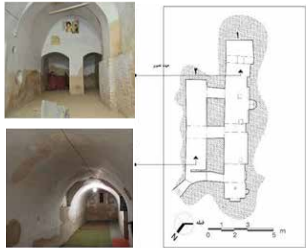
تصویر ۷. فضای دستکند در مسجد سرکوچه محمدیه، نائین.

سکونت در خانه‌های دستکند محدود به دوره‌های پرتنش تاریخی نبوده و دستکندهای مسکونی همواره و حتی در دوره‌های امن تاریخ نیز مورد استفاده بوده‌اند و علاوه بر آن در مجاورت سکونتگاه‌هایی قرار دارند که امکانات استحقاقی مشابهی ندارند. همچنین، در برخی از این روستاها نظیر میمند، خانه‌های جدیدتر نیز از الگوی کلی تاریخی تبعیت کرده‌اند، بنابراین به نظر می‌رسد امنیت استراتژیک نمی‌تواند توجیه مناسبی برای ادامه راه پیشینان باشد. مسئله مهم دیگر، قدمت روستاها بوده که گرچه تاریخ دقیق آن هنوز در حاله‌ای از ابهام است، ولی برخی از پژوهش‌های انجام‌یافته شکل‌گیری روستای کندوان را به مادها و رواج میمند را به دوره ساسانیان نسبت می‌دهند. می‌دانیم با فاصله‌گرفتن از دنیای امروز و بازگشت به تمدن‌های اولیه، کهن‌الگوها و تأثیرات آنها بر رفتار و آیین‌ها قوت می‌یابد. دوره ساسانیان یکی از ادوار درخشش آناهیتا، الهه مادر و باروری و توجه به ارزش‌های مادینه بوده که اسناد تاریخی زیادی در این زمینه موجود و تأمین‌کننده معیار تفسیر این پژوهش است.