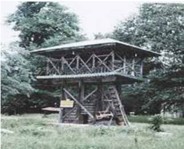
تصویر ۸. نمایی از سقافار کچل ده شهرستان نور. مأخذ: جانعلی زاده چوببستی و ذال، ۱۳۹۰.