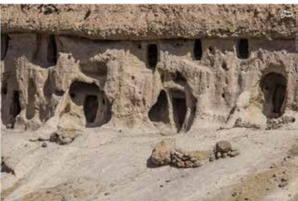
تصویر ۶. نمایی از ایوان‌ها و کیچه‌ها در روستای میمند کرمان، شهر بابک.