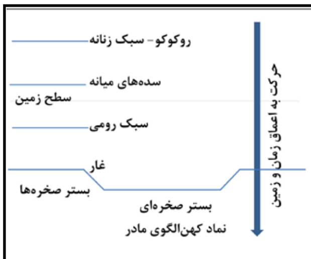
تصویر ۱. ساختار زمان، مکان، روان در خانه رؤیایی یونگ.

در تعریف کهن‌الگوی مادر، یونگ به نقش‌های واقعی مادرانه مثل مادر و مادرزرگ و ایزدبانوان یا مادران مجازی اشاره می‌کند. «نمادهای مادر به طور مجازی در چیزهایی حضور دارد که نشان‌دهنده کوشش برای دستیابی به رستگاری است مانند بهشت، قلمرو الهی و بسیاری از چیزهایی که تعلق خاطر به وجود می‌آورند یا هیبت دارند مثل کلیسا، دانشگاه، شهر یا کشور، آسمان، زمین، جنگل‌ها، دریا یا آب‌های راکد، دنیای زیر زمین و ماه می‌توانند نماد مادر باشند. این کهن‌الگو معمولاً به چیزها و جاهایی ارتباط پیدا می‌کند که نشان‌دهنده باروری و حاصلخیزی هستند. این نماد می‌تواند به صخره، غار،