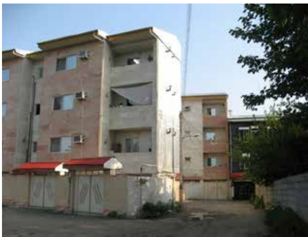
تصویر ۴. رشد فضاهای مسکونی بدون توجه به نیاز ساکنان و معماری بومی منطقه.

کیفی تقسیم می‌شوند. شاخص‌های کمی مسکن شامل تراکم خالص و ناخالص، تراکم خانوار، تراکم نفر در واحد مسکونی، متوسط تعداد اتاق در واحد مسکونی و نسبت رشد خانوار به رشد مسکن می‌شود و شاخص‌های کیفی مسکن نیز نحوه تصرف محل سکونت و وضعیت فیزیکی واحدهای مسکونی را در بر می‌گیرد.