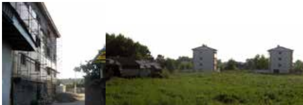
تصویر ۳. ساخت مسکن در زمین‌های زراعی و بدون توجه به بافت مجاور (راست) و ساخت‌وساز گسترده در کوچه‌های باریک (چپ).