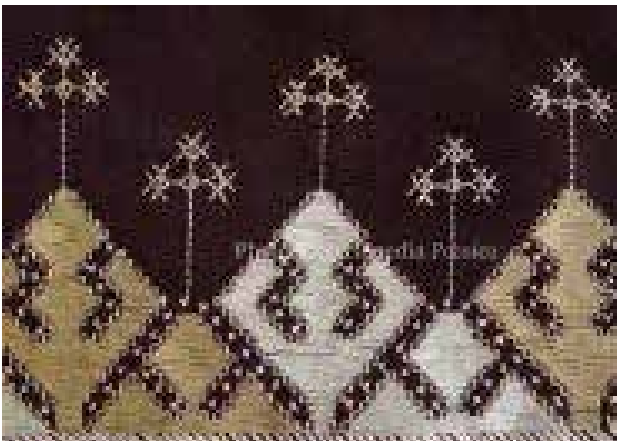
تصویر ۳. نقش مرگ (مرغ) پانچ (پنجه)، مشابه پنجه مرغ.