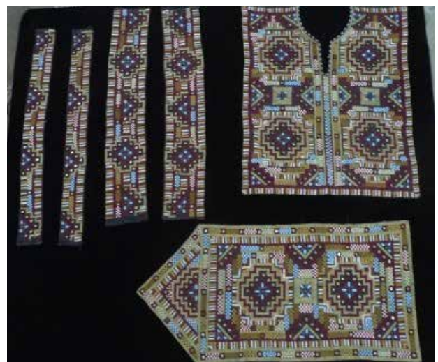
تصویر ۱. زی آستین (سوزن‌دوزی‌های پوشاک زنانه بلوچ) و اجزای آن.

به تکه‌های سوزن‌دوزی لباس زنان «زی آستین» و در مناطقی «گوتمان» گفته می‌شود. زی آستین شامل پیش‌سینه، جیب، سر آستین و دمپای می‌شود (صادقی‌دخت، ۱۳۸۹، ۶۷)؛ (تصویر ۱). نقوش به‌کاررفته در این هنر را می‌توان به انواع انسانی، حیوانی، گیاهی و حاشیه تقسیم کرد که در ادامه نمونه‌هایی از آنها آورده شده است (تصاویر ۲ تا ۷).