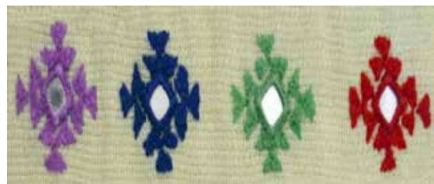
تصویر ۷. نقش هندسی بکالوک.