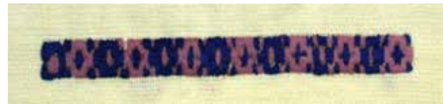
تصویر ۶. موسم (فصل) قریب.