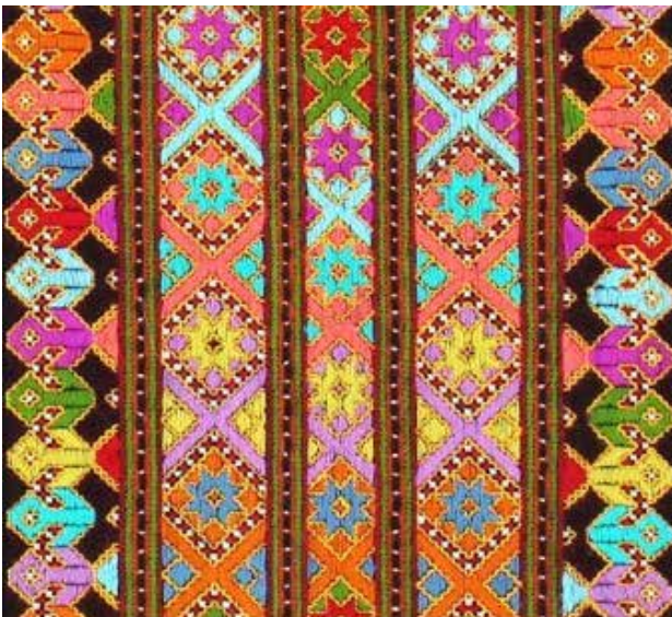
تصویر ۹. نمونه‌ای از ریتم متناوب در سوزن‌دوزی بلوچ.

و آبی می‌توانند مکمل هم باشند. قرمز و سبز تضاد مکمل ۲۱ و قرمز و آبی با هم تضاد همزمانی ۲۲ و فام برقرار می‌کنند. در مجموع نیز می‌توان در ترکیبات رنگی سوزن‌دوزی بلوچ کنتراست فام ۲۳ را تشخیص داد. ترکیب رنگ‌های به کاررفته در سوزن‌دوزی بلوچ را می‌توان از طریق صفاتی چون پرقدرت، زنده و نیروبخش توصیف کرد (ساتن و والان، ۱۳۹۲).