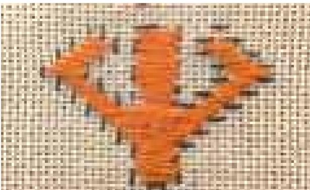
تصویر ۴. نقش گیاهی سروک (سرو کوچک).

روابط استعاری شود. در این مفهوم تصویر روشی برای دیدن گونه‌های از تصویر به جای گونه‌های دیگر است. زیرا «استعاره» ۱۲ در اصل به معنای انتقال دادن است و نقوش استعاری و تجریدی توانایی بیان پدیده‌ها و معانی غایب را دارند» (سامرز به نقل از گات و مک‌ایور، ۱۳۹۳، ۲۱۲). به همین دلیل شناخت مفاهیم نمادین نقوش هنرهای سنتی بسیار پیچیده است و همواره فرضیات گوناگونی درباره آن مطرح خواهد بود.