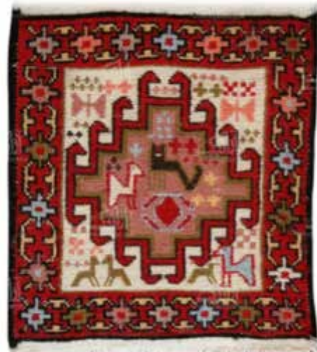
تصویر ۱۰. یک نمونه ورنی، گلیم سوزنی از اردبیل با نقوش هندسی و خطوط راست.

با توجه به اهمیت سمبولیسم در نقوش هندسی و براساس معنای تجرید و انتزاع که پیش‌تر مورد اشاره قرار گرفت،