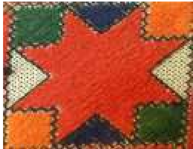
تصویر ۵. گل سهر (سرخ) نمونه‌ای از نقوش گیاهی سوزن‌دوزی بلوچ. می‌توان این نقش را برگرفته از خورشید نیز دانست که در گذر زمان به عنصری گیاهی نسبت داده شده است.

بافت ۱۷ را به لحاظ تراکم می‌توان به انواع متراکم و نیمه‌متراکم تقسیم‌بندی کرد. بافت در سوزن‌دوزی بلوچ از طریق تراکم، تکرار و ترکیب انواع خط‌ها و اشکال هندسی در کنار بافت رنگی به‌وجود می‌آید. در زیبایی‌شناسی بلوچی‌دوزی، به‌صورت منفرد، می‌توان بافت سوزن‌دوزی را از نوع متراکم دانست. اما از آنجا که اساس کاربرد این سوزن‌دوزی‌ها در تزئین پوشاک است، باید به جلوه بافت این سوزن‌دوزی‌ها در لباس‌های بلوچی نیز توجه کرد