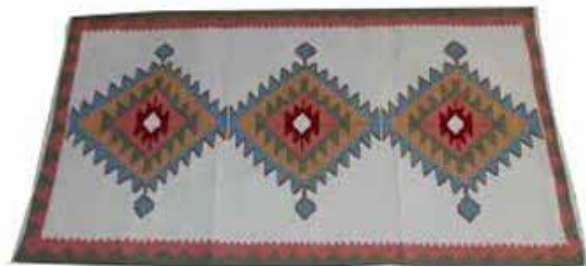
تصویر ۱۱. نقش حوضی در گلیم بافی عشایر لرستان، مشابه نقش چارچم (چهار چشم) در سوزن‌دوزی بلوچ.

زیبایی‌شناسی فنی هنر سنتی تولیدشده نیز محفوظ بماند. اما اصل در زیبایی‌شناسی این هنر فراتر از تأثیرات بصری زیبایی بر حس بینایی است و زیبایی این هنر سنتی در نمادپردازی فرهنگی آنان است که انتزاع را به پراهمیت‌ترین وجه زیبایی‌شناسانه آثارشان تبدیل کرده است.