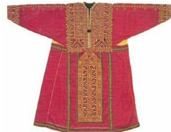
تصویر ۸. پیراهن زنانه سوزن‌دوزی شده بلوچ.

همان‌گونه که مشاهده می‌شود، در انواع نقوش به‌کاررفته در این سوزن‌دوزی‌ها تمامی خطوط صاف و زاویه‌دار هستند و به‌ندرت می‌توان خطی منحنی در آنها یافت. عوامل مختلفی را به‌عنوان بن‌مایه‌های مؤثر بر شکل‌گیری این نقوش معرفی کرده‌اند. به‌صورت کلی نوع طبیعت، آب و هوا، ذهنیات، روحیات و آداب و رسوم را در تعیین نوع نقش مؤثر و همین مسئله را دلیل تفاوت دوخت و نقش هر منطقه با منطقه دیگر می‌دانند. ۱۵ اما در کل دوخت این نقوش بر پایه شمارش تارهای پارچه بوده و به‌همین دلیل از پارچه‌هایی با تار و پود عمود برهم در آن استفاده می‌شود.