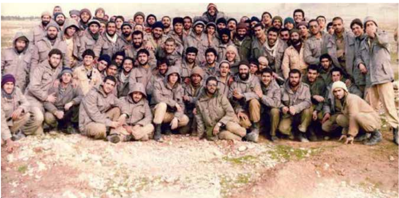
تصویر ۱۰. عکس دسته‌جمعی از یکی از گروهان‌های گردان کمیل.