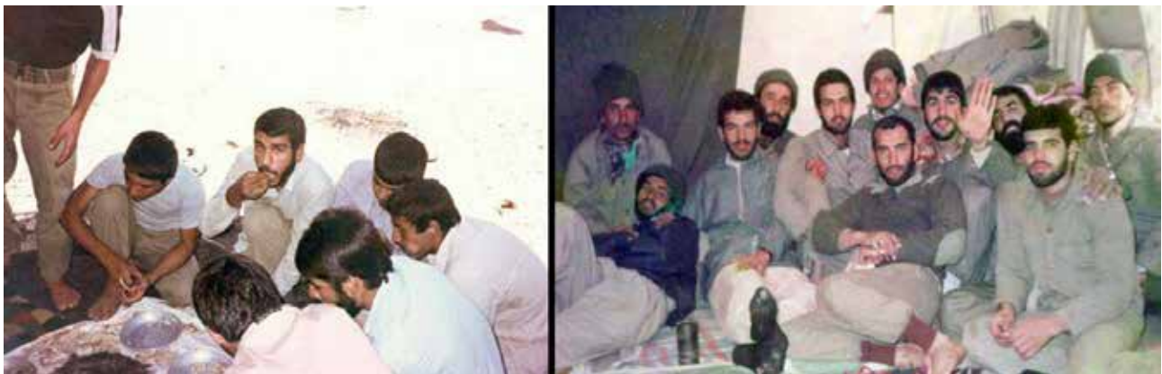
تصویر ۶. سادگی وسایل، البسه و به صورت کلی رزمندگان در عکس.

جدول ۴. تحلیل گفتمان انتقادی عامل وسایل، اشیاء و سلاح‌های موجود در عکس در تصاویر عملیات والفجر مقدماتی. مأخذ: نگارندگان.