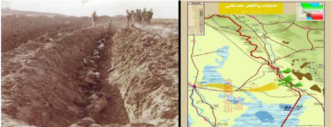
تصویر ۴. محدوده جغرافیایی عملیات والفجر مقدماتی.

نور موجود در عکس: در مجموعه تصاویر عملیات والفجر مقدماتی، رنگ نوری عکس‌هایی که در کوهستان عکاسی شده با عکس‌های دشت تفاوت دارد. عکس‌های کوهستان تنالیت‌های تیره دارد و عکس‌های دشت تنالیت‌های روشن (تصویر ۸ و جدول ۶). پیش‌زمینه و پس‌زمینه عکس‌ها: در پس‌زمینه و پیش‌زمینه