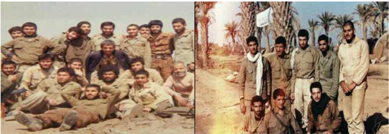
تصویر ۷. شیوه ایستادن و نشستن رزمندگان.