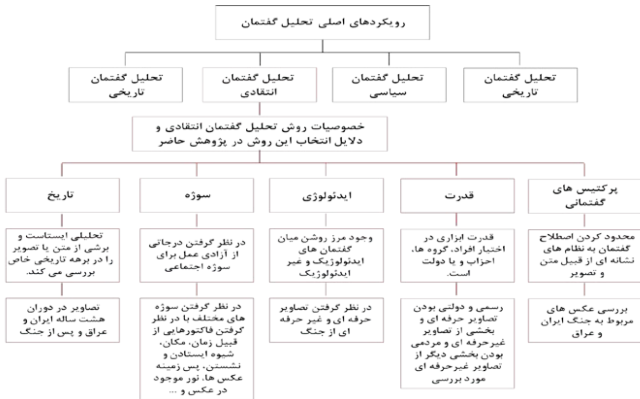
تصویر ۱. رویکردهای اصلی تحلیل گفتمان و ویژگی‌های تحلیل گفتمان انتقادی.

مورد فکه نگاه رسمی، عملیات والفجر مقدماتی را شکستی بزرگ به حساب آورد تا جایی که نام‌گذاری این عملیات پس از شکست، به عنوان «مقدماتی» تأییدکننده این موضوع است. این در حالی است که در روایت مردمی، عملیات والفجر مقدماتی یک پیروزی است و تجلی هویت مسلمان شیعه در تاریخ معاصر است. کانال کمیل به سبب شهادت مظلومانه بسیاری از رزمندگان، ظهر عاشورا پذیرای عده زیادی از مردم شهرهای دور و نزدیک برای برگزاری مراسم ظهر عاشورا است. موقعیت افراد محاصره شده در کانال، سختی‌ها و مقاومت‌های روایت‌شده از رزمندگان باقی‌مانده گردان‌های «کمیل» و «حفظه» باعث شده که مردم رزمندگان این کانال را شبیه به سپاهیان امام حسین (ع) در روز عاشورا بدانند ( گروه فرهنگی شهید ابراهیم هادی، ۱۳۹۱، ۱ ). در واقع وقتی رزمندگان در میان دو تپه منطقه عملیاتی فکه محاصره شدند بعد از سه روز مقاومت با لب تشنه قتل عام شدند، بنابراین این منطقه به «قتلگاه عاشورا» معروف شده است. حتی بعد از سقوط فکه و وقتی پاسگاه‌های منطقه سقوط کردند، نیروهای مستقر هنگام عقب‌نشینی راه را گم کرده و به دلیل تشنگی به شهادت رسیدند ( ربیعی و تمنایی، ۱۳۹۲، ۱۰ ). • عکس جنگ به مثابه متن علیرضا کمری می‌گوید: «سرشت زبان فارسی ادبی است ... وقتی کسی می‌گوید (داستان آن مرد...)، از سطح آهنگ کلام تا خود کلمه‌ها و جمله‌ها و عبارات کاملاً ادبی یا تصویرسازی ادبی هستند- بی‌آنکه شخص آن را اراده کرده باشد» ( کمری، ۱۳۸۸، ۱۲ ).