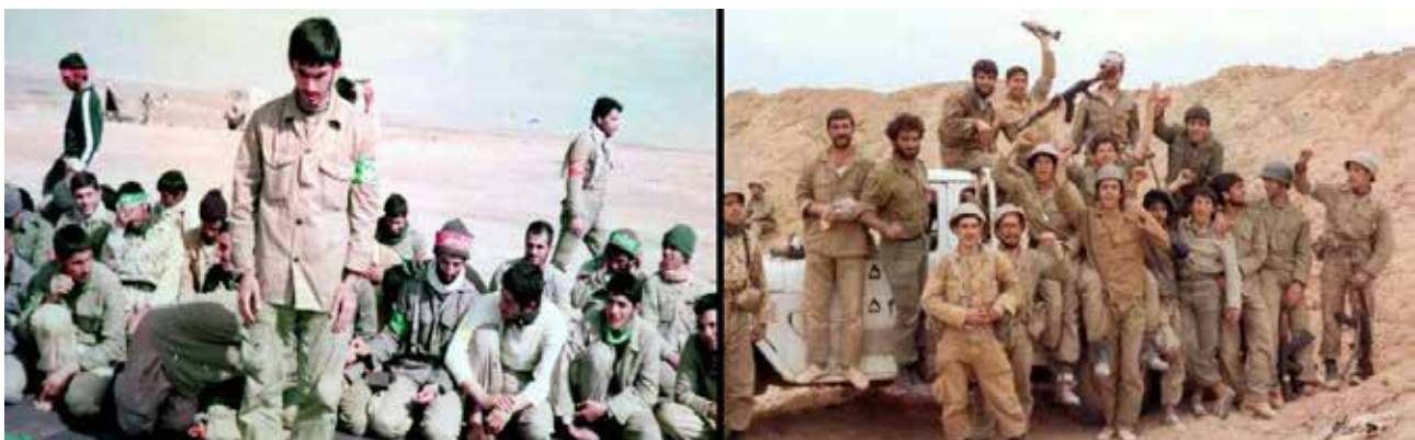
تصویر ۵. تنوع در لباس‌های رزمندگان به واسطه وابستگی نظامی آن‌ها.