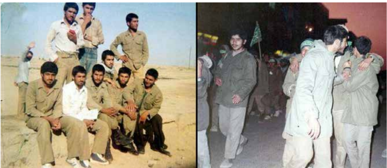
تصویر ۸. نور موجود در عکس.