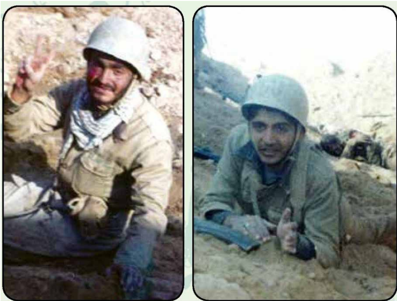
تصویر ۱۱. اشکالات تکنیکی عکس‌ها.

جدول ۸. تحلیل گفتمان انتقادی عامل زاویه عکاسی و اشکالات تکنیکی در عکس‌ها در تصاویر عملیات والفجر مقدماتی. مأخذ: نگارندگان.