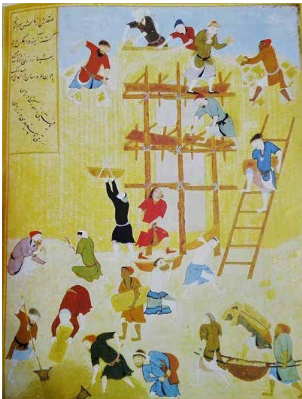
تصویر ۳. مینیاتور ساختمان کاخ کورنق، بهزاد.

چنین به نظر می‌رسد، دلیل دیگر علاقه تیمور به گردهمایی هنرمندان، «تلاش برای هم‌طرز کردن پایتختش با شهرهایی بوده است که طی جنگ‌ها و فتوحات به چشم خود دیده و عظمت و زیبایی آن شهرها توجهش را جلب کرده بود» (کاووسی، ۱۳۸۵، ۳۳-۳۴). اما «ظاهراً تأمین مالی نمی‌توانست از انگیزه‌های اصلی طرح معماری او باشد؛ چون تیمور به قدر کافی منابع مالی در اختیار داشت و نیازی به این نوع تمهیدات اقتصادی نداشت. یکی از اهداف اصلی تیمور در بنیان عمارات، جاودان‌سازی نامش بود و این نکته از طرح مسجد جامع سمرقند پیداست. او با گردآوری هنرمندان و پیشه‌وران نقاط مختلف جهان اسلام می‌خواست به طرح‌های هنر و معماری خود بعد بین‌المللی دهد» (آژند، ۱۳۸۱، ۴۸). از ارکان معماری تیموری می‌توان به دو مورد ابعاد عظیم و تزیینات بسیار زیاد اشاره کرد چنانکه: «تأکید این سبک بر ابعاد عظیم، فضاهای باز و طراحی منطقی و متناسب و تنوع فضایی، میراثی غنی برای دانشجویان صفوی و شیبانی‌اش به جا نهاد. در عین حال، معماری تیموری در دیگر عرصه‌های معماری، به ویژه طاق‌بندی و تزیین رنگی، معیارهایی بر جا گذاشت... شاید به نظر برخی، تمرکز مداوم بر این گونه تزیین غنی، حالتی افراطی باشد. این تمرکز به معنای آن است