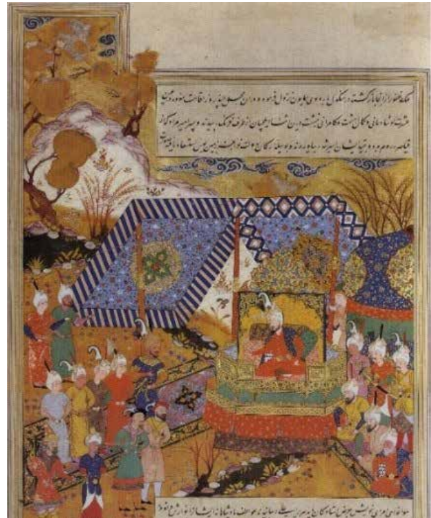
تصویر ۱. مینیاتور تیمور در باغ. ظفرنامه تیموری.

این عصر را خاطر نشان کرد (سمانی دستجردی؛ فروغی ابری و الهیاری، ۱۳۹۵، ۱۰۲).