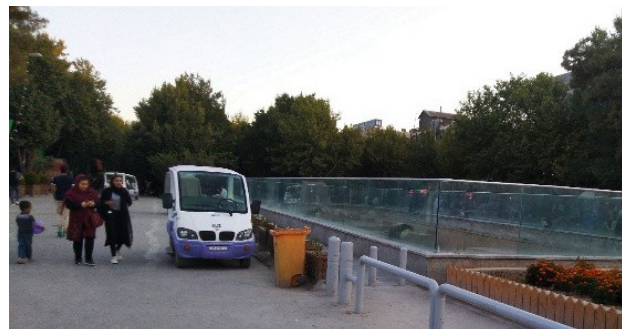
تصویر ۸. مسیر تردد خودروی برقی در خیابان چهارباغ عباسی. عکس: سودابه قلی‌پور، ۱۳۹۸.

و اقداماتی را که برای ارتقای این خیابان مؤثر دانسته‌اند، زیرشاخص‌هایی برای چهار شاخص کالبدی، اجتماعی، اقتصادی و زیست‌محیطی استخراج شده است.