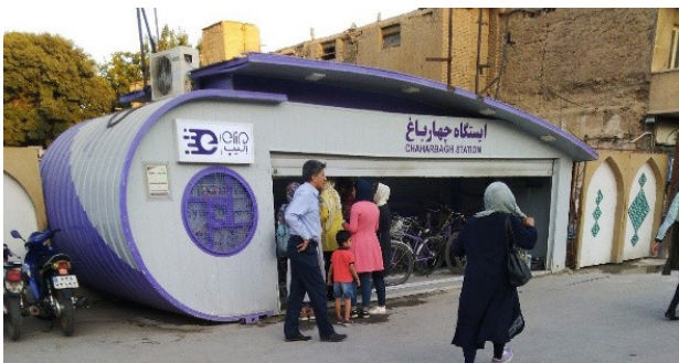
تصویر ۹. ایستگاه چهارباغ برای امانت دوچرخه در خیابان چهارباغ عباسی. عکس: سودابه قلی‌پور، ۱۳۹۸.