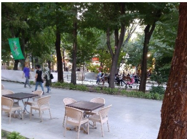
تصویر ۶. کافه‌های روباز در خیابان چهارباغ عباسی. عکس: سودابه قلی‌پور، ۱۳۹۸.

کف این خیابان سنگفرش بوده و برای کف‌سازی آن از قلوه‌سنگ‌های داخل رودخانه زاینده‌رود در دو اندازه متوسط و نسبتاً درشت‌تر استفاده شده‌است که با مهارت‌های خاص در بستر گل‌آهکی این