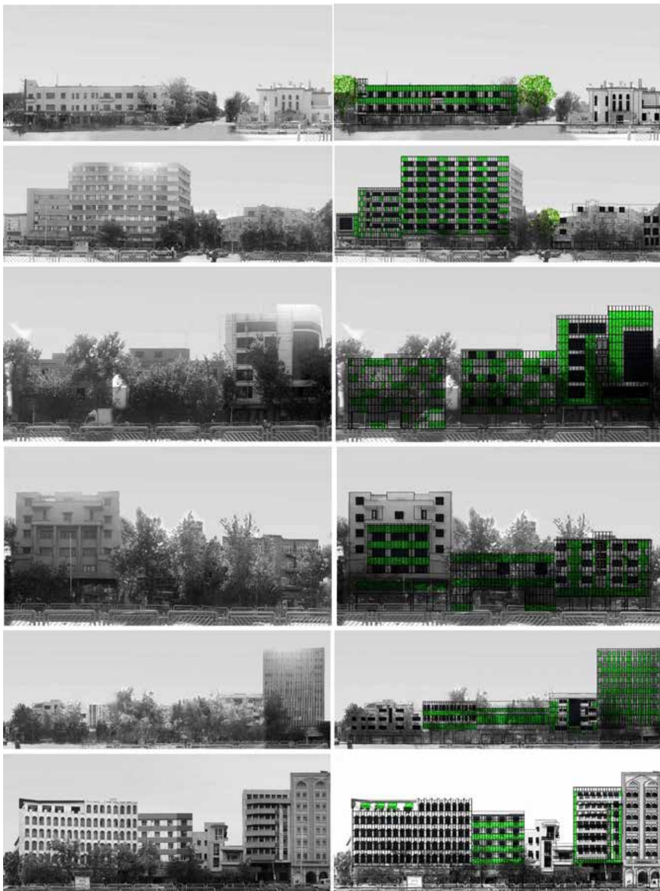
تصویر ۱. الف) مقایسه سیمای شهری جنبه جنوبی خیابان انقلاب با در نظر گرفتن پانل‌های حاوی ریزجلبک.