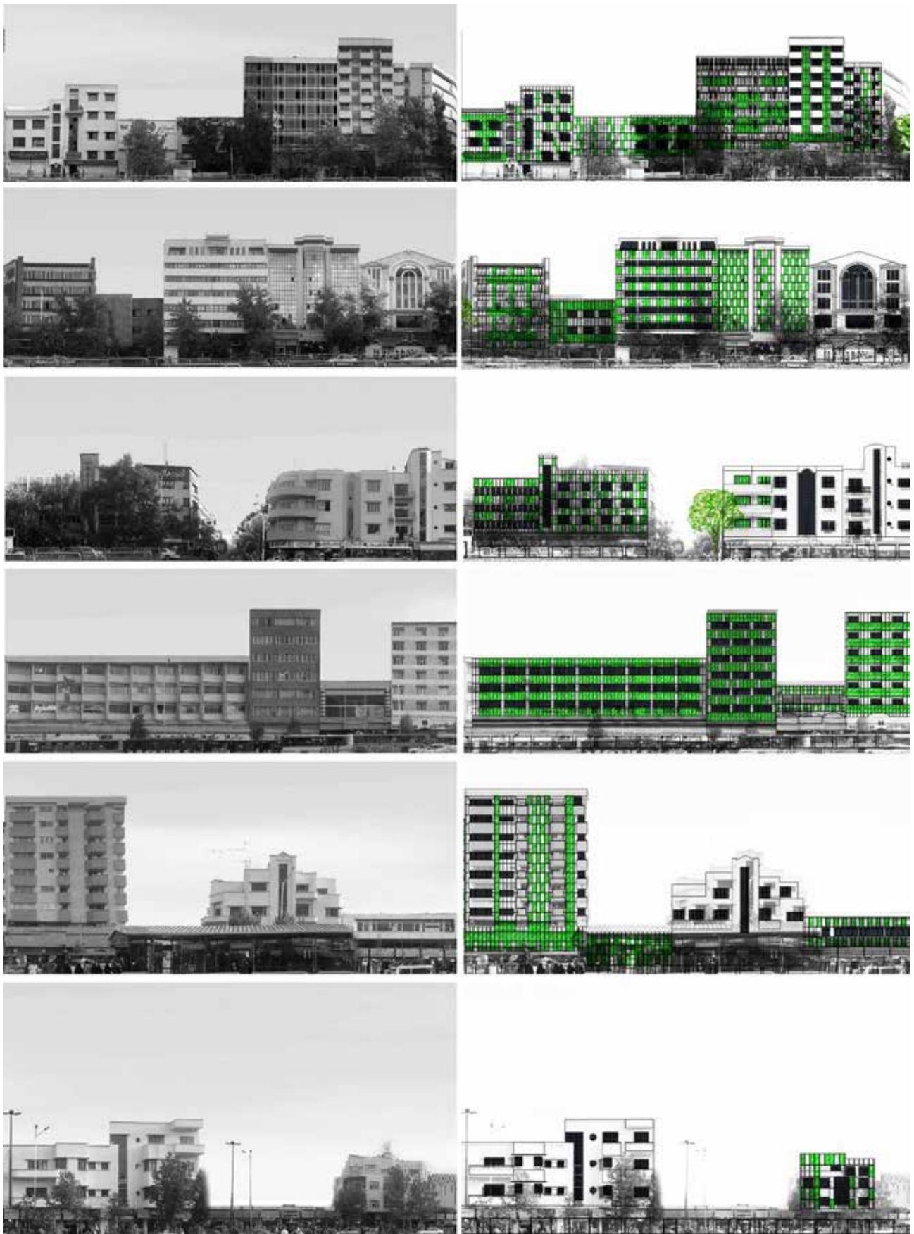
تصویر ۱. ب) مقایسه سیمای شهری جبهه جنوبی خیابان انقلاب با در نظر گرفتن پانل‌های حاوی ریزجلبک.