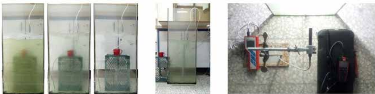
تصویر ۳. زیست رآکتور ساخته شده و تجهیزات مورد استفاده در فرایند آزمایش.

جداره‌های ساختمان و بدنه‌های شهری را با این زیست رآکتور پوشش داد، در بازه زمانی بسیار کوتاه می‌توان میزان دی‌اکسید کربن موجود در هوا را به مقدار قابل توجهی به صورت پایدار کاهش داد و در جهت ارتقای بهبود کیفیت هوا و حفظ و پایداری محیط زیست شهری به‌عنوان سیاست و هدف اصلی این نوشتار، گام مؤثری برداشت.