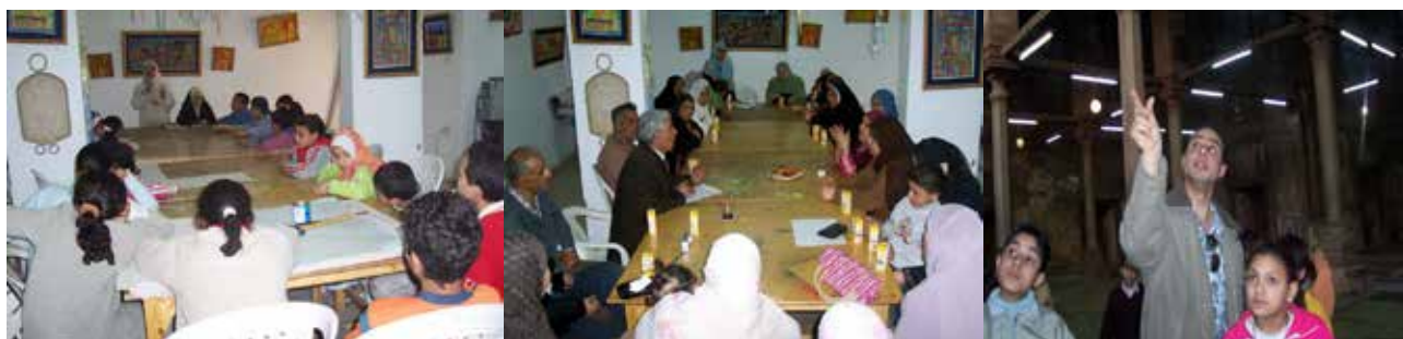
تصویر ۶. مسئولان در حال توضیح اقدامات حفاظتی برای مردم محلی، کودکان و دانش‌آموزان. مأخذ: Lamei, 2011.

جدول ۲. سیاست‌های گردشگری پایدار به‌کاررفته در پروژه مرمت خیابان المعز. مأخذ: نگارنده.