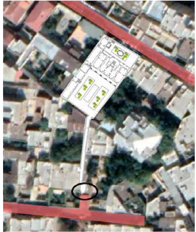
تصویر ۱. پلان خانه شربت اوغلی و جانمایی نمای مورد مطالعه در آن.

در رابطه با معنای بیانی نما و چگونگی توصیف آن اشاره به مثالی از خود پانوفسکی بسیار مفید است. او در این رابطه، ویژگی‌های آرامش‌بخش و دنج برای یک فضای داخلی را نمونه‌ای از معنای بیانی معرفی کرده است (پانوفسکی، ۱۳۹۵، ۳۷) که مشخصاً مثالی در حوزه معماری است. در ارتباط با نمای خانه شربت‌اوغلی، به واسطه قوس مرتفع میانی، خطوط عمودی و گچبری‌های کشیده در دو طرف آن، تأکیدی بر محور عمودی قابل مشاهده است؛ هرچند این تأکید با خطوط افقی