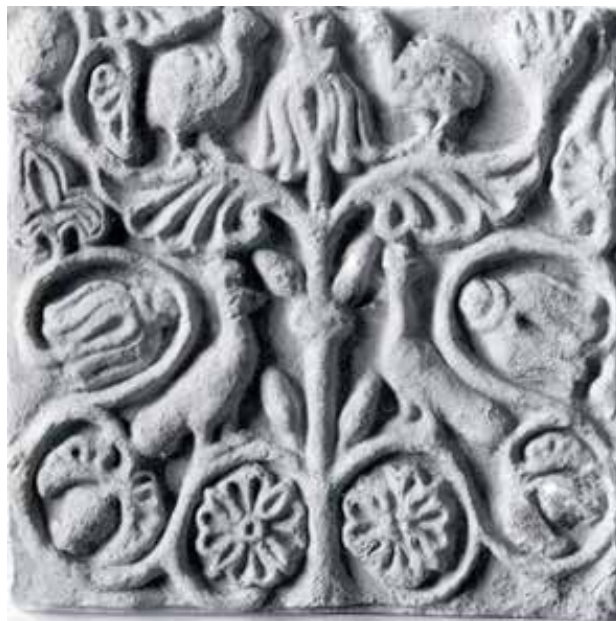
تصویر ۶. نقش مایه درخت زندگی و طاووس بر روی لوح گچی تیسفون، دوره ساسانیان. موزه متروپولیتن.

۱. بهره‌گیری از خوانش آیکونولوژیک در مطالعه نمای خانه‌های تاریخی این امکان را برای پژوهشگر فراهم می‌آورد که با نزدیک شدن به معانی نهفته در آن، از افکار خودآگاه و ناخودآگاهی که در ذهن معمار نما، سازنده آن، صاحبخانه و یا هر فرد دخیل دیگری وجود داشته و در شکل‌گیری نما مؤثر