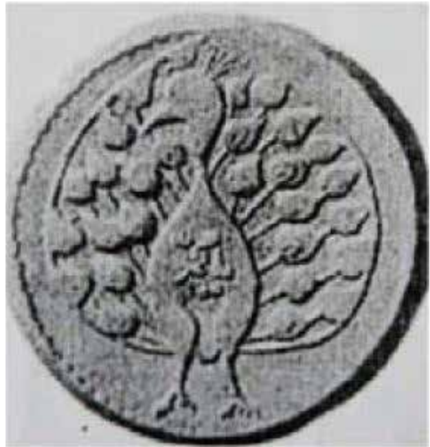
تصویر ۸. سکه طلا مربوط به دوره قاجار. مأخذ: پوپ و آکرمن، ۱۳۸۷، ۱۴۸۷.

۵. روش پانوفسکی را بعضی منتقدان همچون «گادامر» نه تاریخ‌نگاری بلکه عقایدنگاری می‌دانند؛ که منظور از آن توصیف دیدگاه‌ها و عقاید غالب یک دوره تاریخی بر اساس آثار به دست آمده از آن دوره است (حسینی دستجردی، ۱۳۹۵، ۱۵۴). بر مبنای این انتقادات در این روش استقلال اثر از میان رفته و اثر به متون ادبی و حوزه‌های مختلف علوم انسانی همچون اسطوره‌شناسی گره زده می‌شود (نصری، ۱۳۹۱، ۱۸). با این اوصاف این روش برای مطالعه نماهای تاریخی، نما را وابسته