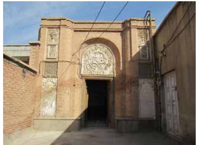
تصویر ۲. نمای رو به معبر شمالی خانه شربت‌اوغلی. عکس: سمیه جلالی میلانی، ۱۳۹۵.

حال باید دید که چه مباحثی می‌تواند تأمین‌کننده تجربه عملی لازم برای توصیف پیش‌آیکنوگرافیک نمای خانه شربت اوغلی باشد؛ معنای طبیعی این نما چگونه قابل دستیابی است و تاریخ سبک‌ها به چه نحو می‌تواند برای پیشگیری از بروز خطا در توصیف به کمک آید.