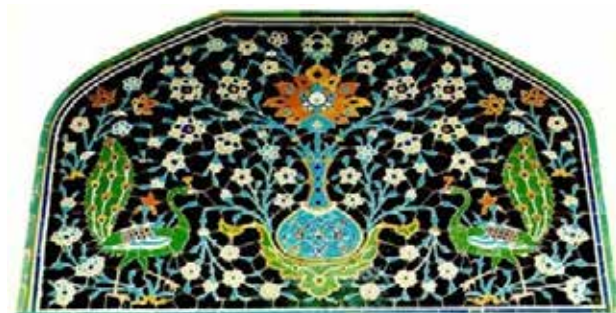
تصویر ۷. نقش مایه‌های دو طاووس و درخت زندگی، سردر مسجد امام اصفهان، دوره صفویه. مأخذ: خزایی، ۱۳۸۶.

کار رفته است؛ به طوری که این تصویر در معماری بناهایی با کارکرد غیر مذهبی نیز دیده می‌شود (تصویر ۹). به این ترتیب با آگاهی یافتن از معانی نقش مایه‌های به کار رفته در گچبری سردر خانه شربت‌اوغلی، برای تفسیر آیکونولوژیک نمای این خانه فرضیه‌ای به ذهن می‌رسد؛ و آن اینکه سردر ورودی تعبیه شده در این نما، منقش به آرایه‌هایی شده است که به طور نمادین دلالت‌کننده بر خوش‌آمدگویی و طلب خیر برای عبورکنندگان از آن‌اند. به عبارت دیگر سازندگان نما و صاحبخانه در آرزوی ساختن بهشتی زمینی در فضای این خانه، و دور کردن پلیدی‌ها، بلاها و شیاطین از خانه و واردشوندگان به آن، و افزایش برکت روزی، دست به دامان چنین نقشی بر روی نمای رو به بیرون خانه شده‌اند. علاوه بر این سرشناس بودن مالک خانه و برخوردار بودن او از وضعیت مطلوب مالی این فرض را تقویت می‌کند که صاحبخانه تمایل داشته است تا طلب خیر برای واردشوندگان به خانه‌اش را کمابیش از طریق نمایش موقعیت اجتماعی خود به آنها به