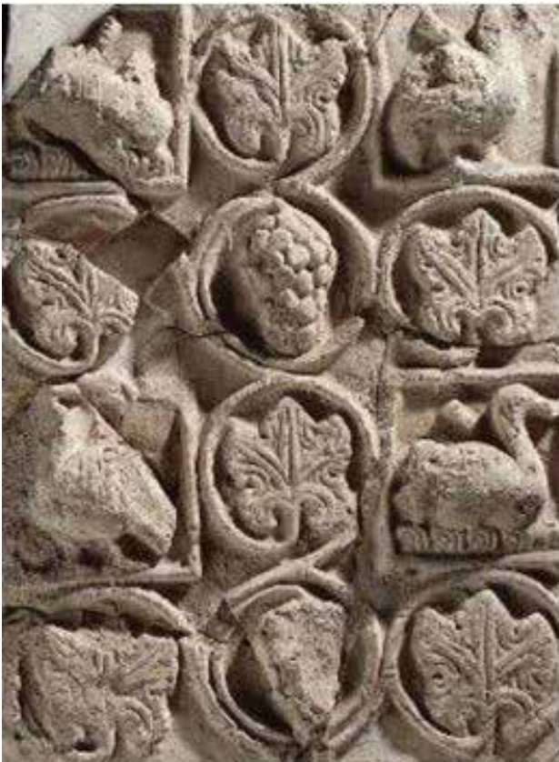
تصویر ۱۰. گچبری با نقش پرند بر شاخه انگور، چال ترخان.

توصیف و تحلیل و فهم معنای جنبه‌های ساختاری نماهای خانه‌های تاریخی و بخش‌هایی که واجد ویژگی‌های فرمی و فضایی هستند، در کنار الحاقات واجد ویژگی‌های تصویری به کار برد. این در حالی است که مرتبه سوم صرفاً قابل کار بست بر بخش‌های تصویری نماست که عموماً تحت عنوان تزئینات از آن یاد می‌شود.