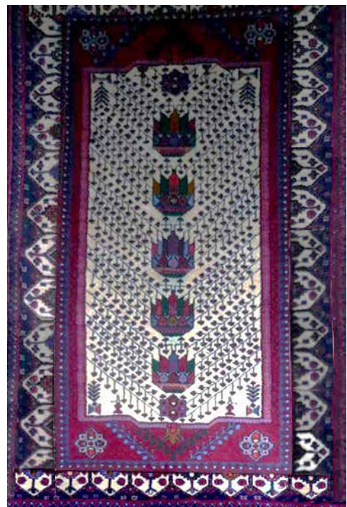
تصویر ۵ (راست). نقشه کاسه‌بشقابی و گیلای (بافت روستای چناقچی).