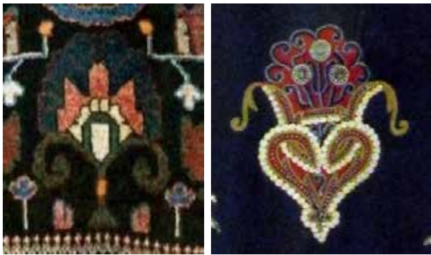
تصویر ۲۲ (راست). نقش گلدان بر پارچه تزیینی ارمنی، کلیسای مریم مقدس تهران. مأخذ: آرشیو نگارندگان. تصویر ۲۳ (چپ). نقش گلدان در قالی ارمنی، جزئی از تصویر ۱۸. مأخذ: آرشیو نگارندگان.