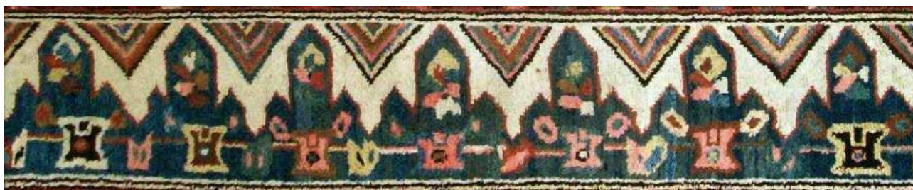
تصویر ۲۵. حاشیه کلیسا (چاناخچی) در قالی ارمنی، جزئی از تصویر ۸.