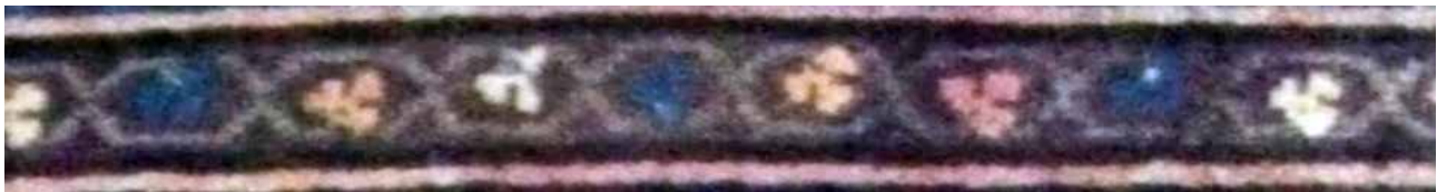
تصویر ۴۴. حاشیه بلوجیک قرینه (بافت روستای آلاچان).