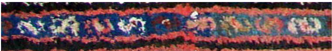
تصویر ۴۶. حاشیه S.