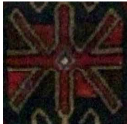
تصویر ۳۰ (راست). چلیپا با تکرار بازوها، جزئی از تصویر ۱۵. مأخذ: آرشیو نگارندگان. تصویر ۳۱ (وسط). نقش آستخ در قالی بافت پنبک. مأخذ: آرشیو نگارندگان. تصویر ۳۲ (چپ). نقش ستاره بشارت گر بر روی کفش زنانه ارمنی، کلیسای مریم مقدس تهران. مأخذ: آرشیو نگارندگان.