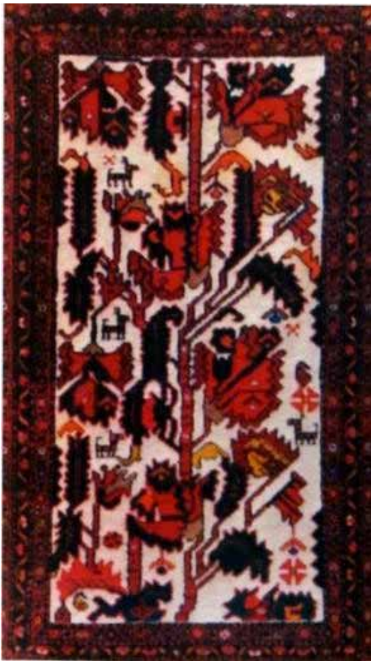
تصویر ۱. نقشهٔ بوته‌خاری (بافت روستای لار).