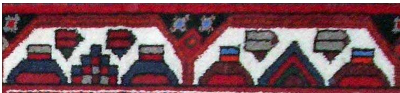
تصویر ۲۶. حاشیه یورت در قالی شاهسون، خرقان.