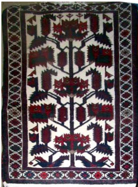
تصویر ۲. قالی نقشه‌ارمنی، نقشهٔ بوته‌خاری (بافت شاهسون‌های خرقان).

رو، قالی نقشه‌ارمنی با طرح اقتباسی در نوع نقوش به‌کاررفته از نمونه‌های مشابه بازشناخته می‌شود. این نقشه‌ها گاه از مناطق و اقوام هم‌جوار متأثرند و گاه از دیگر بافته‌ها و نقوش خاص ارمنی الهام گرفته شده‌اند. آنچه سبب تمایز و شناخت این نقشه‌ها از موارد مشابه در میان اقوام هم‌جوار می‌شود تأثیر ویژگی‌های فرهنگ ارمنی بر قالی‌های ارمنی‌باف است. در ادامه، نقوش قالی‌های نقشه‌ارمنی در سه بخش کلی متن، حاشیهٔ بزرگ و حاشیهٔ کوچک بررسی می‌شوند.