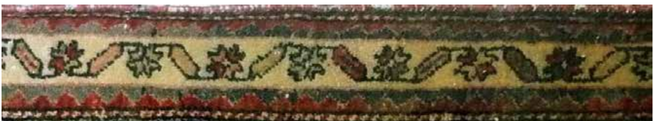
تصویر ۳۷. حاشیه بلوجیک، جزئی از تصویر ۱۸ (بافت روستای چوزه).