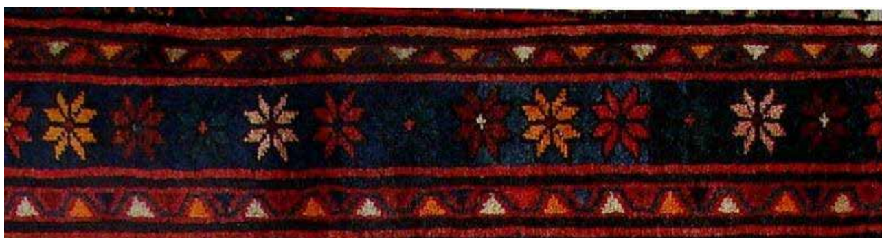
تصویر ۲۹. حاشیه آستخ در قالی ارمنی، جزئی از تصویر ۹.