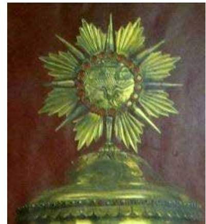
تصویر ۳۳ (راست). نقش ستاره بشارت گر بر ظرف ارمنی، کلیسای مریم مقدس تهران. مأخذ: آرشیو نگارندگان. تصویر ۳۴ (وسط). چلیپا با تکرار بازوها، کلیسای مریم مقدس تهران. مأخذ: آرشیو نگارندگان. تصویر ۳۵ (چپ). نقش آستخ بر کلاه اسقف ارمنی، کلیسای مریم مقدس تهران. مأخذ: آرشیو نگارندگان.