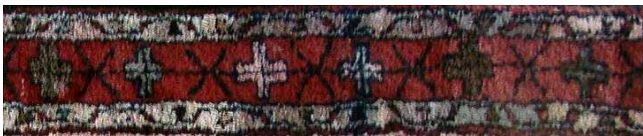
تصویر ۲۸. حاشیه چلیپا در قالی ارمنی.