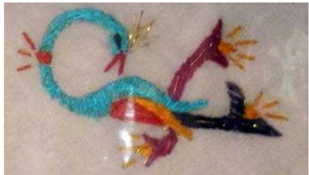
تصویر ۴۱. نقش شانه به سر بر پارچه تزیینی ارمنی، کلیسای مریم مقدس تهران.

- حاشیه S: این حاشیه با نقش قلاب، در جهات افقی، عمودی، و قرینه، با تناوب رنگی در طول حاشیه کوچک کاربرد دارد و گاه به عنوان خرده نقش در متن هم استفاده می شود (تصاویر ۴۶ و ۴۷). همچنین به نظر می رسد نزدیکی این نقش با برخی از صورت های نوشتاری در فرهنگ ارمنی، بر حضور بیشتر آن در بافته های ارمنی بی تأثیر نبوده است. نماد S شکل اولین حرف کلمه ارمنی Seta (تر) به معنی ذات باری تعالی است (کاراپتیان، ۱۳۹۱).