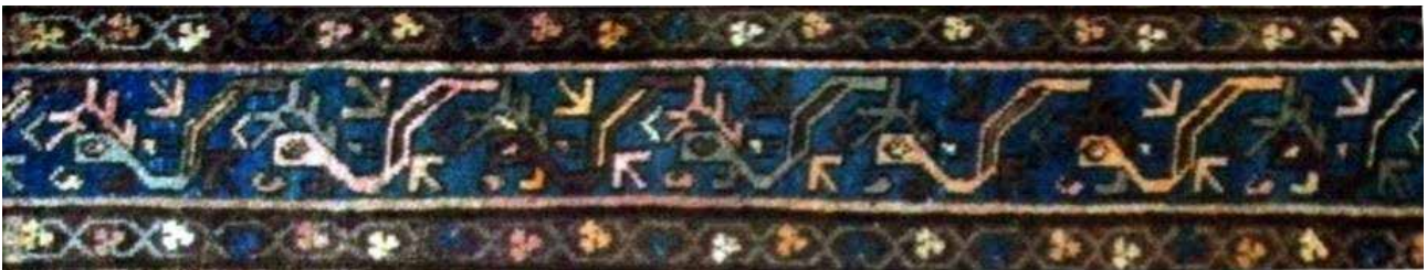
تصویر ۳۸. حاشیه شانه‌بسر (بافت روستای آلاچان).

– حاشیه شانه‌بسر: این نقش، که از حاشیه‌های رایج در قالی‌های ارمنی خرقان است، معمولاً با تناوب رنگی به‌صورت واگیره به‌کار می‌رود و گاه تک‌رنگ و خطی است (تصاویر ۳۸، ۳۹ و ۴۰). نقش شانه‌بسر بر منسوجات و پارچه‌های ارمنی نیز تصویر و بافته می‌شود (تصویر ۴۱). بنا بر افسانه‌های ارمنی پیش از مسیحیت، شانه‌بسر با کندن پره‌های والدینش و لیسیدن چشم‌هایشان فروغ جوانی را به آن‌ها باز می‌گرداند. شانه‌بسر به‌سبب این اعجاز، نماد کیمیاگرانه آب حیات و بازیابی جوانی و درنهایت ولادت ثانوی روحانی است. به همین دلیل است که عامه معتقدند چشم شانه‌بسر گنج‌های پنهان را می‌بیند و آب‌های زیرزمینی را کشف می‌کند. شانه‌بسر در اسطوره‌ها و منظومه‌های ایرانی نیز خبرآور و واسطه میان خلق و خداوند است و نیز آموزگار غیب و صاحب اسرار و