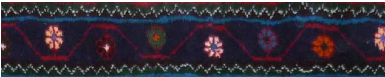
تصویر ۳۶. حاشیه بلوجیک (بافت روستای لار).