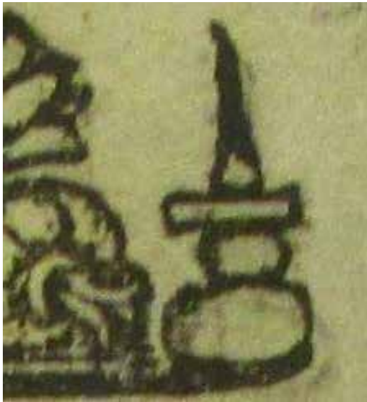
تصویر ۴. نقش چراغ در سرلوح انجیل.

گل‌افشان: در متن این نقشه آنچه بیشتر به چشم می‌آید گل‌های درشت در میان نقش‌مایه‌های خرد است (تصاویر ۸ و ۹). در این میان، گل آفتابگردان و گل‌فرنگ بیشترین