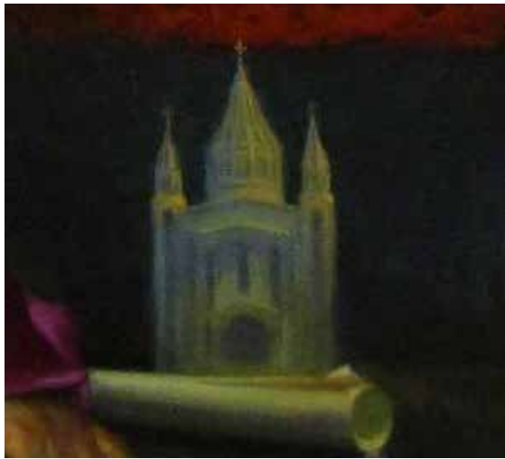
تصویر ۲۴. نقش کلیسا در نقاشی ارمنی، کلیسای مریم مقدس تهران.