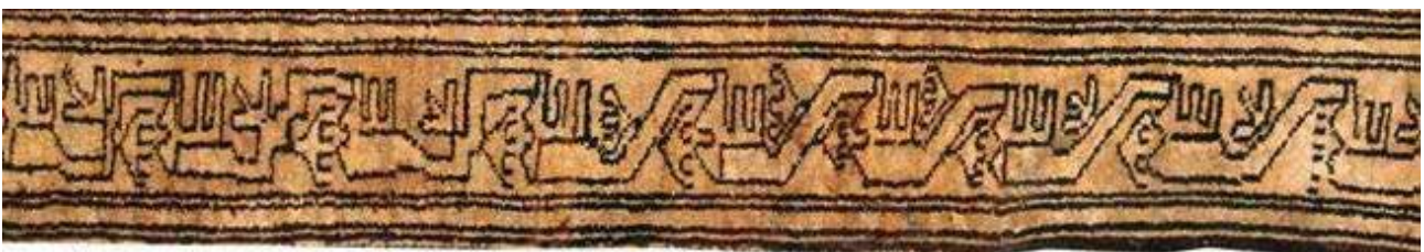
تصویر ۳۹. حاشیه شانه‌بسر (بافت منطقه آبگرم).