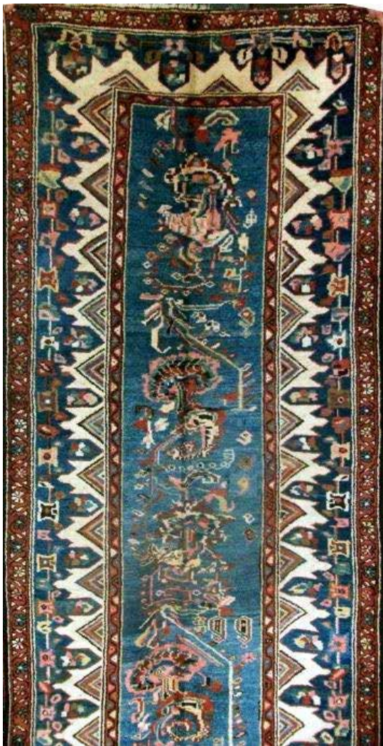
تصویر ۹. نقشه افشان گل‌بتویی (بافت روستای چوزه)، از مجموعه مهدی کبیری.