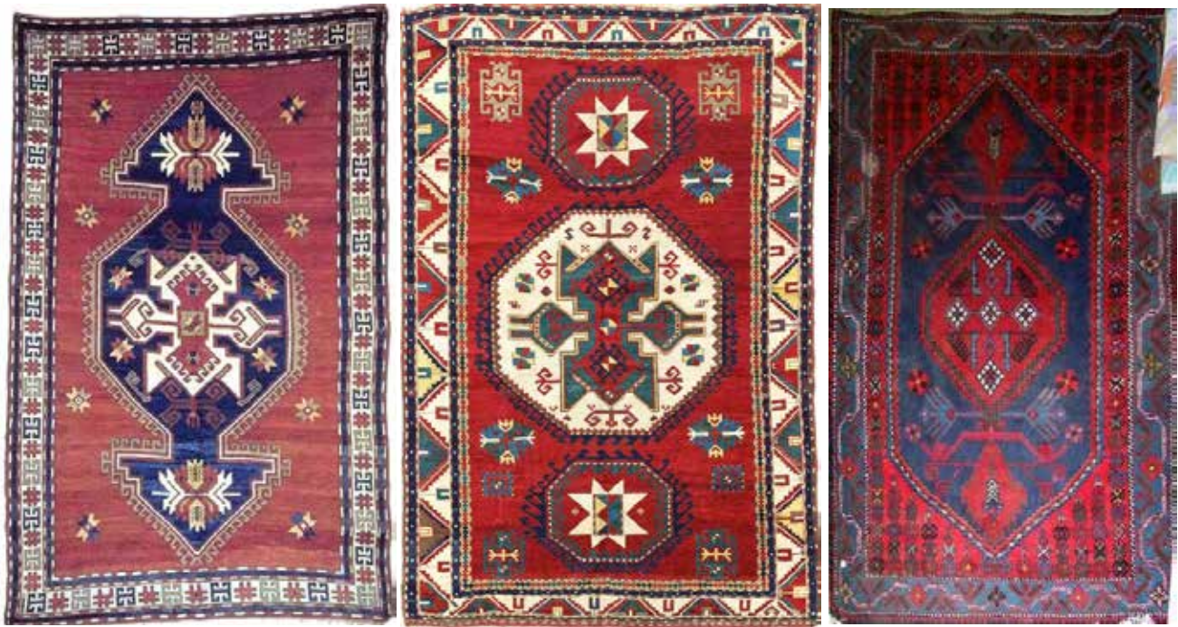
تصویر ۱۰ (راست). نقشه ترنج چلیپای خرقان. تصویر ۱۱ (وسط). نقشه ترنج چلیپای پنبک. تصویر ۱۲ (چپ). ترنج چلیپا پنبک.