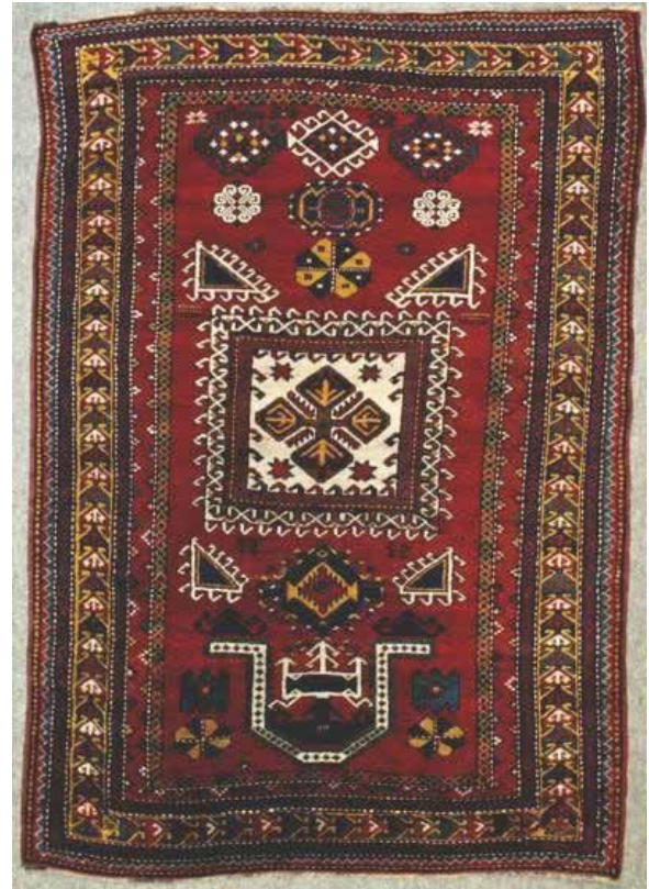
تصویر ۱۷. نقشه گلدانی (بافت روستای پنبک).

صورت دیگری از حاشیه کلیسا، در نقشه‌های کاسه‌بشقابی، قالی‌های ارمنی را از نمونه‌های شاهسونی متمایز می‌کند. اگرچه طرح کلی و فضا سازی حاشیه در هر دو شبیه است، جزئیات نقوش و آرایه‌ها هر حاشیه را به نمونه ارمنی یا شاهسون نسبت می‌دهد. حاشیه معمول در نقشه‌های کاسه‌بشقابی شاهسون، که با نام