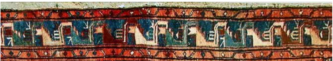
تصویر ۴۰. حاشیه شانه‌بسر (بافت روستای لار).