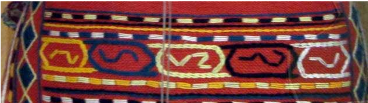
تصویر ۴۷. لباس زنانه ارمنی با نوار تزئینی S.