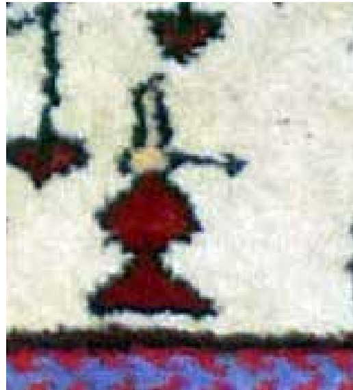
تصویر ۳. نقش چراغ در قالی ارمنی، جزئی از تصویر ۵.