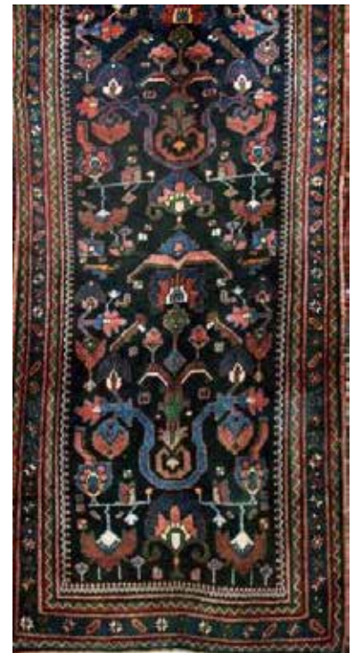
تصویر ۱۸. نقشه گلدانی (بافت روستای چوزه). مأخذ: آرشیو نگارندگان. تصویر ۱۹. نقشه گلدانی (بافت روستای چوزه). مأخذ: آرشیو نگارندگان. تصویر ۲۰. نقشه گلدانی (بافت روستای چوزه). مأخذ: آرشیو نگارندگان.