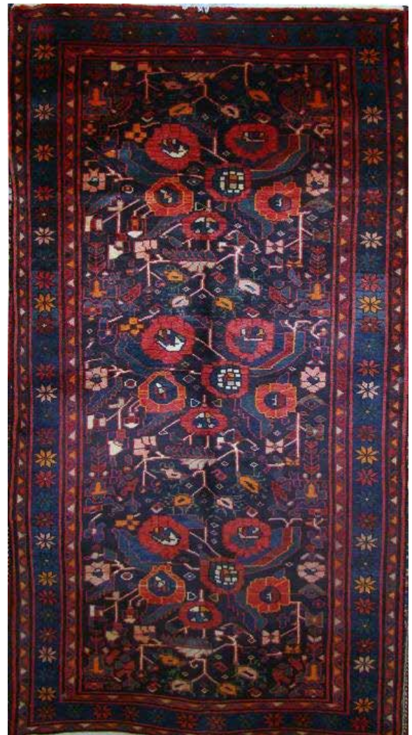
تصویر ۸. نقشه افشان آفتابگردان (بافت روستای چناقچی).

که ساکنان آن ارمنی نیستند – نیز رواج دارد. حضور دیگر نقوش شاخص ارمنی، مانند گل چهار و هشت‌پر، و حاشیه موسوم به بلوجیک در بافته‌های توآباد قابل توجه است. این ویژگی‌ها با در نظر گرفتن هم‌جواری توآباد با روستاهای ارمنی‌نشین خرقان، گواه تأییدپذیری بافته‌های این روستا از قالی‌های ارمنی است (تصاویر ۱۵ و ۱۶).