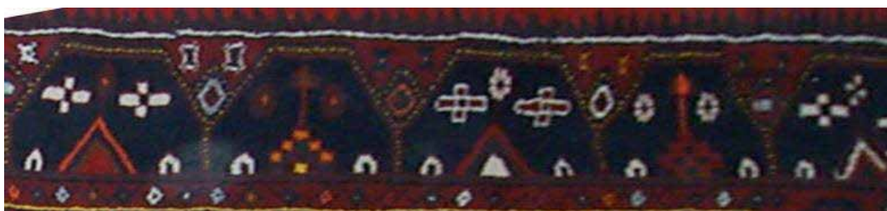
تصویر ۲۷. حاشیه کلیسا در قالی ارمنی، جزئی از تصویر ۶، خرقان.