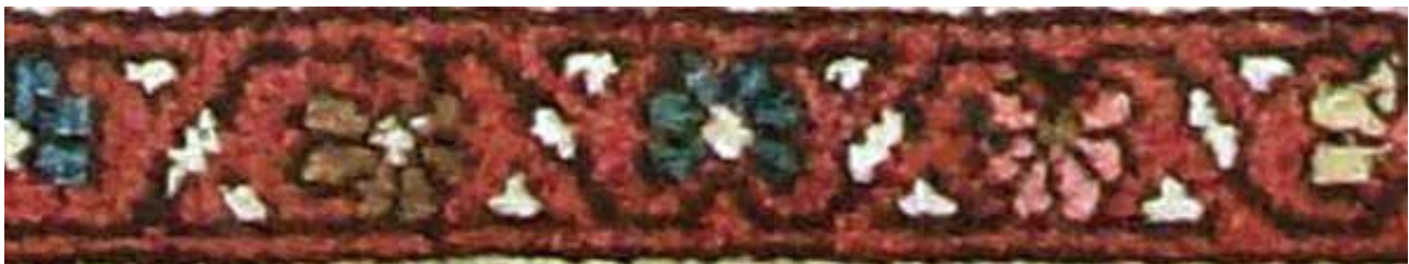
تصویر ۴۲. حاشیه بلوجیک (بافت خرقان).