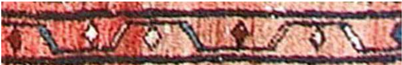
تصویر ۴۳. حاشیه بلوجیک (بافت روستای لار).