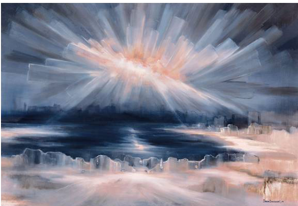
تصویر ۲. نقاشی «خورشید شکسته» اثر ایران درودی، ۱۹۹۳. مأخذ: درودی، ۱۳۸۳، ۱۵۱.

«یخ» و «انجماد» از یک سو نشان از گونه‌ای «سرماي درونی» دارد. آنجا که به تعبیری در سوگ ۲۴ «جهان فقیر و خالی می‌شود» (سانتر، ۱۳۹۶، ۲۹۲). با مرور آثار درودی مشخص می‌شود که با آغاز دوره «یخبندان» استفاده از رنگ‌های گرم مانند رنگ قرمز در ترکیب‌بندی‌ها کاهش می‌یابد. این آغاز دوره‌ای است که نقاش دور از وطن و با ازدست‌دادن عزیزان «شور و شیفگی» خود را نیز از دست می‌دهد (مظفری ساوجی، ۱۳۸۸، ۴۰۹). در بسیاری از آثار این دوره درحالی‌که فضای نقاشی روشن است، خورشید از پشت آسمان یخ‌زده دیده نمی‌شود یا از شدت کم‌نوری و در غبار شبیه ماه به نظر می‌رسد ۲۵ ؛ مانند آنچه در «خورشید شکسته» (۱۹۹۳) دیده می‌شود. در این اثر شعاع‌های نور خورشید به شکل نوارها یا قالب‌های عریض یخ به تصویر کشیده شده است (تصویر ۲). استفاده از