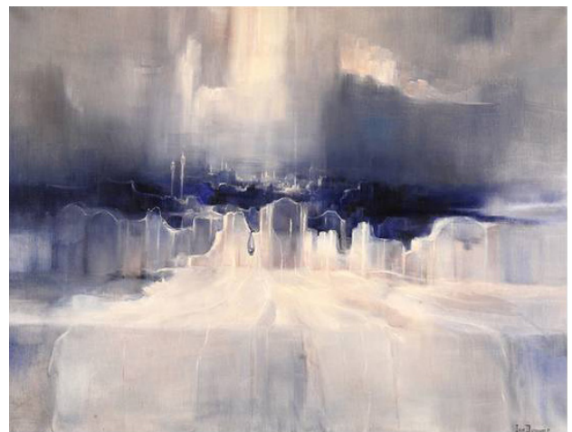
تصویر ۱. نقاشی «عروسی جاودانه»، اثر ایران درودی، ۱۹۷۶. مأخذ: درودی، ۱۳۸۳، ۱۷.

در نقاشی «عروسی جاودانه» (تصویر ۱) که یکی از نمونه‌های معروف ۱۸ دوره یخبندان درودی است، این موضوع و ساختار فضایی مرتبط با آن به شکلی آشکار مجسم شده است. ویرانه‌ها در این اثر با اشغال سطح قابل توجهی از تابلو، سازنده ژرفای اثر به سمت افق دور هستند. در این تابلو نیز مانند بسیاری از آثار این دوران، ویرانه‌ها در چند پلان اجرا شده‌اند. در پلان جلوتر ۱۹ اثر فرسایش و فروریختگی در شکل طاق‌نماها و دیوارها مشهود است. در پلان عقب‌تر دورنمایی از شهری دیده می‌شود که گلدسته‌ها، مناره‌ها و خانه‌های آن میان رنگ‌های سرد و کبود ناپدید و محو می‌شوند. هر دو این دورنماها را می‌توان تجسمی از «وطن» دانست.