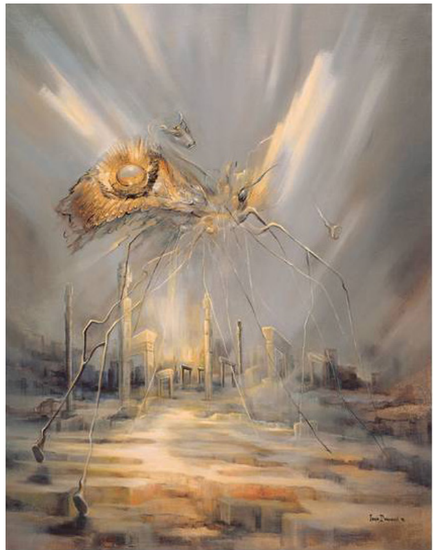
تصویر ۳. نقاشی «گسستن»، اثر ایران درودی، ۱۹۷۶. مأخذ: درودی، ۱۳۸۳، ۶۷.

تصاویر اشغال ایران در خلال جنگ جهانی دوم در دوران کودکی، تبعید خودخواسته از وطن در اواخر دهه ۵۰ و همچنین ویرانه‌های جنگ ایران و عراق در دهه ۶۰ (که نمود آن‌ها در آثار متعددی آشکار است) به نحوی باعث تشدید نیروگذاری روانی بر ایژه «وطن» می‌شود. البته باید در نظر داشت که تصویر ویرانه‌ها پیش از دوران «یخبندان» نیز در آثار درودی حضور دارد؛ اما غالباً این ویرانه‌ها در فضای شهری جدید تصویر می‌شدند و مضمون اجتماعی-انتقادی بارزتری داشتند. در یکی از آثار جالب‌توجه این دوران به نام «رکود خاطره» (۱۹۶۹) ستون‌های ویرانه سنگی به هیئت انسانی‌هایی مصلوب درآمده‌اند که به نحوی یادآور مجسمه‌های آلبرتو جاکومتی (۱۹۶۶-۱۹۰۱ م.) است (تصویر ۴). ردپای این هیئت در آثار دوره یخبندان نیز در قالب ستون‌های فرسوده تنها در برون لایتناهی یا کنار طاق‌نماهای ویران قابل‌رؤیت است. حتی در اثر «عروسی جاودانه» (نک. تصویر ۱) نیز به نظر می‌رسد جفت‌بودن ستون‌های مناره‌گون یادآور همین هیئت‌های انسان‌نما باشد که در اینجا احتمالاً در ارتباط با محتوای نقاشی به معنای ابدی‌ساختن «پیوند» قرار گرفته است.