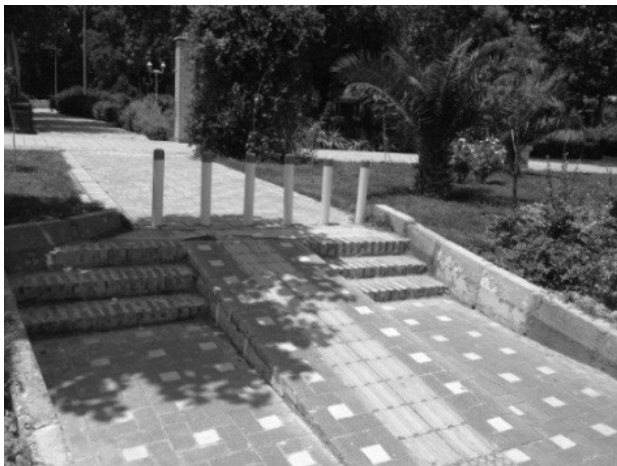
تصویر ۳. عدم دسترس پذیری مسیرهای تردد. عکس: ندا رفیع‌زاده، ۱۳۹۵.