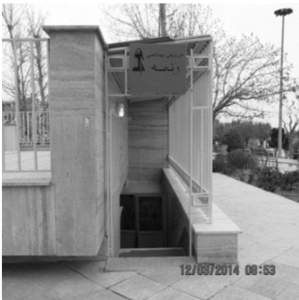
تصویر ۵. عدم دسترس پذیری سرویس بهداشتی. عکس: ندا رفیع‌زاده، ۱۳۹۵.