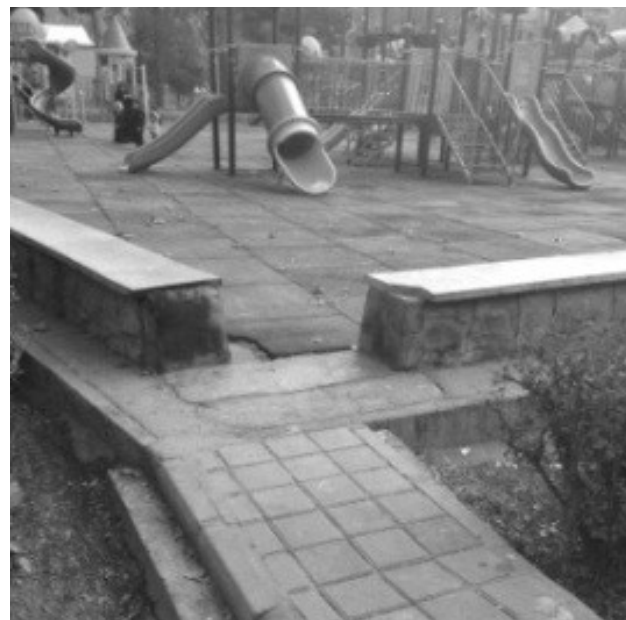
تصویر ۴. عدم دسترس پذیری فضای بازی و ورزش.