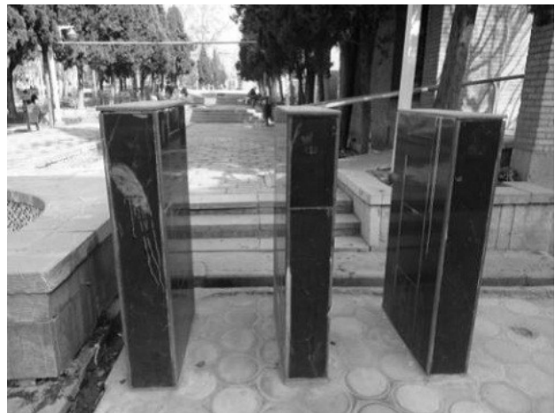
تصویر ۲. عدم دسترس پذیری ورودی. عکس: ندا رفیع‌زاده، ۱۳۹۵.