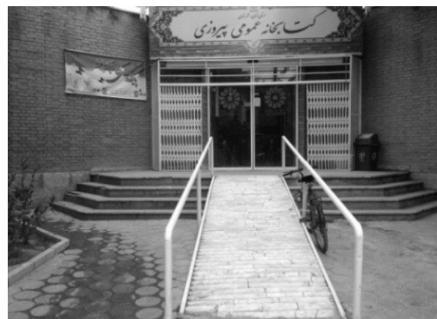
تصویر ۶. عدم دسترس پذیری ساختمان‌های عمومی به دلیل نامناسب بودن سطح شیب‌دار. عکس: ندا رفیع‌زاده، ۱۳۹۵.

اهمیت عدالت اجتماعی و اصل برابری فرصت‌ها با برآورده ساختن نیازهای فیزیکی و روانی همه افراد جامعه فارغ از میزان توانایی فیزیکی و حسی آنها، بحث دسترس پذیری محیط شهری را به عنوان یکی از اصول کالبدی طراحی فراگیر، ضروری می‌سازد. در این مقاله، نحوه دسترس پذیری بوستان‌ها در شهر تهران مورد بررسی قرار گرفته است. به همین منظور، ابتدا با مرور ادبیات نظری و تجربی، شاخص‌های مرتبط با طراحی فراگیر در قالب شاخص‌های کالبدی و غیرکالبدی طبقه‌بندی شده و در کنار شاخص‌های دسترس پذیری بوستان‌های شهری به منظور ارزیابی دسترس پذیری اجزای تشکیل‌دهنده بوستان‌ها مانند ورودی‌ها، مسیرهای تردد، ساختمان‌های عمومی، سرویس‌های بهداشتی،