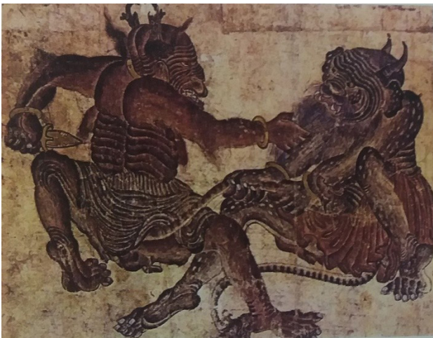
تصویر ۱. محمد سیاه قلم، هرات. مأخذ: آژند، ۱۳۹۲، ۳۵۳.

همگان قرار نگرفته است، اما همگان بر آن اند که این آثار کار یک نفر هنرمند مسلمان است (همان). همچنین این آثار در عین شباهتی که به نقاشی چینی دارند، چینی نیستند. به عنوان مثال در نگارگری ایران نشان دادن دندانها کمتر ممکن است به چشم بخورد، در حالی که در آثار «محمد سیاه قلم» این مورد دیده می شود، که شاید از نقاشی چینی