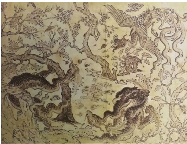
تصویر ۵. محمد سیاه قلم، هرات.

وام گرفته شده باشد (O. Kane, 2003, 5) با توجه به اینکه دربارهٔ هویت «محمد سیاه قلم» و آثار او آرای متفاوتی وجود دارد، گاهی برای آثار او منشأ چینی قائل شده و زمانی آنها را جلوه‌ای از زندگی ایلات و عشایر آسیای میانه و آیین‌های شمنی دانسته‌اند (تصویر ۳).