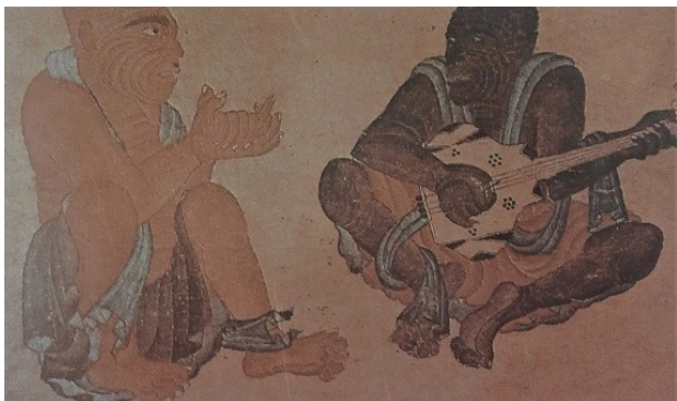
تصویر ۴. محمد سیاه قلم، هرات.