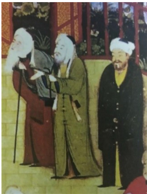
تصویر ۷. بخشی از اثر، کمال‌الدین بهزاد، هرات. مأخذ: آژند، ۱۳۹۲، ۳۱۴.