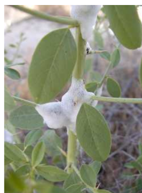
شکل (۲) تولید کف روی شاخه خارشتر