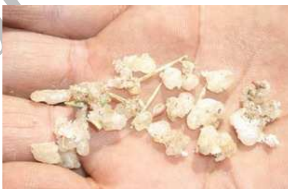
شکل (۶) مان ترنجبین جدا شده از شاخه در شهریور ماه

جدول (۱) میانگین (± خطای معیار) طول دوره نسل‌های مختلف زنجری. Poophilus nebulosus Leth (روز) و درجه حرارت و رطوبت مناسب برای ظهور زنجبرک در تربت جام در سال ۱۳۸۶