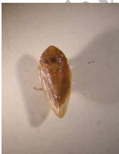
شکل (۴) حشره کامل زنجری Poophilus nebulosus Leth با بزرگنمایی ۱۶ برابر