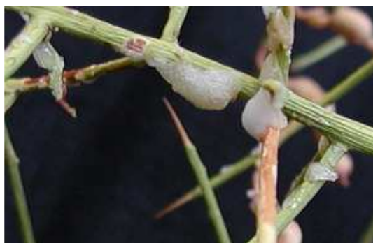
شکل (۵) فعالیت نسل ۲ و ۳ بر روی بوته خارشتر به صورت مان - ترنجبین

پورگی شروع گردید. در نتیجه تولید اولین بلوره‌های ترنجبین نتیجه فعالیت نسل دوم حشره بود. گرچه بلوره‌های بوجود آمده از سنین اول، دوم و حتی سوم پورگی بسیار ریز بودند. در سنین بعدی و در حشره بالغ اندازه بلورها بتدریج درشت تر شدند (شکل‌های ۵ و ۶).