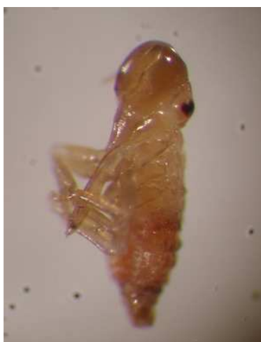
شکل (۳) پوره سن ۲ نسل اول - با بزرگنمایی ۴۰ برابر

پس از تولید کف، حشره در داخل کف حرکت کرده و از آن به عنوان محیط مرطوب و محافظت کننده استفاده می‌کند. برای اندازه گیری طول بدن از تعداد ۲۰ نمونه زنجره استفاده گردید. پوره‌های سن اول بعد از ۵۰/۶۶± روز پوست اندازی کردند و پوره‌های سن دوم ظاهر شدند. آنها نیز تولید کف کردند. این کف در پایین ترین بخش اندام‌های هوایی گیاه و نزدیک طوقه تشکیل شد. اندازه پوره‌های سن اول و دوم به ترتیب ۱۴/۱± و ۱/۲± میلی‌متر بود.