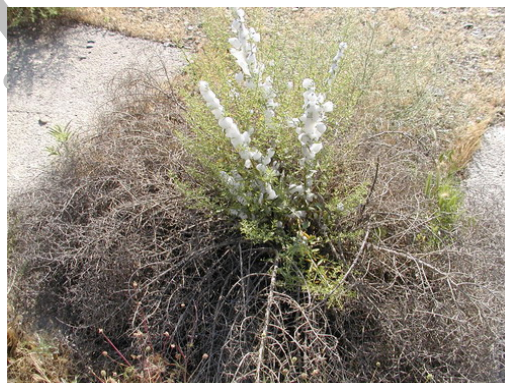
شکل (۱) فعالیت نسل اول روی بوته خارشتر به صورت تولید کف