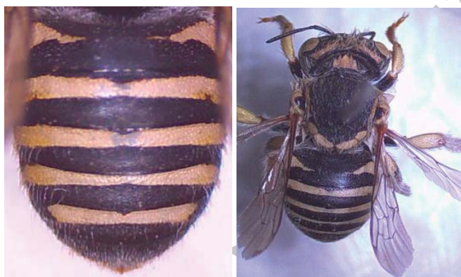
رگیال قاعده ای

در این بررسی، نمونه هایی از ۶ خانواده از بالاخانواده Apoidea جمع آوری گردید که مشتمل بر ۱۵ جنس و ۶ گونه است. در مجموع ۳۶۰ زنبور از روی یونجه جمع آوری شد که از میان ۱۳ گونه شناسایی شده، گونه Anthidium (Latreille, 1809) که متعلق به زیرخانواده Megachilinae می باشد، از روی یونجه در تاریخ های ۸۹/۴/۲۸ و ۸۹/۴/۱۸ به ترتیب در شهرستان های چناران با فراوانی نسبی ۰/۵۹ درصد و مشهد با فراوانی نسبی ۰/۵۲ درصد جمع آوری و شناسایی شد. وجود این گونه در ایران برای اولین بار گزارش می شود. در ایران از جنس Anthidium نه گونه گزارش شده است (۵). این گونه در سطح