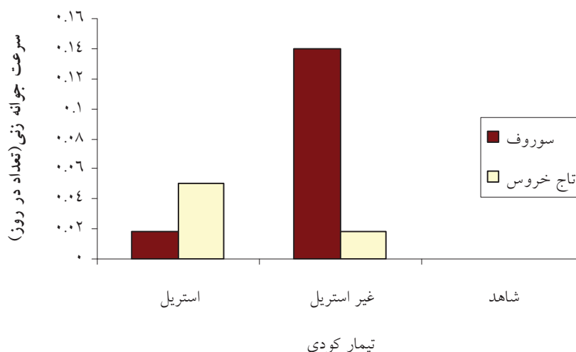
شکل ۲- سرعت جوانه زنی بذر سوروف و تاج خروس در تیمار کود استریل و غیر استریل در دمای آزمایشگاه (حدود ۲۵ تا ۲۸ درجه سانتی گراد)

کمترین درصد جوانه زنی بذر علفهای هرز تاج‌خروس و سوروف