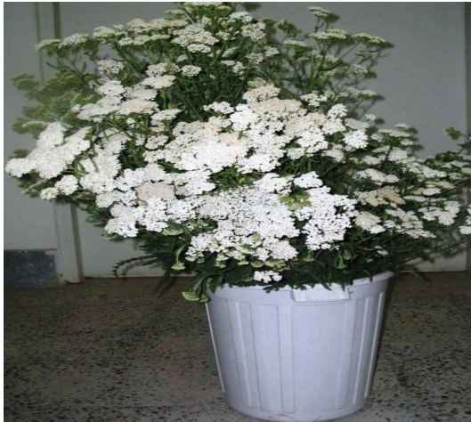
(شکل ۴) - A. millefolium پس از برداشت