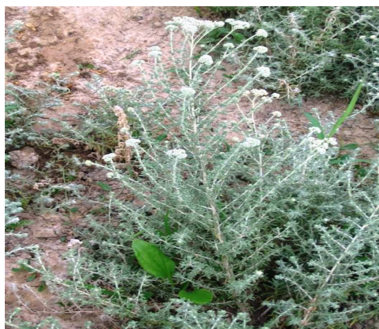
(شکل ۱) - A. eriophora در مرحله قبل از گلدهی