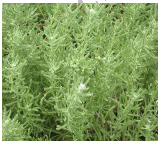
(شکل ۲) - A. wilhelmsii در مرحله قبل از گلدهی

بومادران تماشائی A. nobilis گیاهی است نسبتاً دیر گل، با ارتفاع نسبتاً بلند (حدود ۶۵ سانتی متر)، گل های سفید متمایل به کرم و نسبتاً درشت (با قطر بزرگتر از ارتفاع گل آذین)، از نظر تعداد جست متوسط است، تولید گل آذین های جانبی کمی کرده و بیشتر به صورت تک گل روی بوته دیده می شود. این گونه طول دوره گلدهی متوسطی دارد (تصویر ۵).