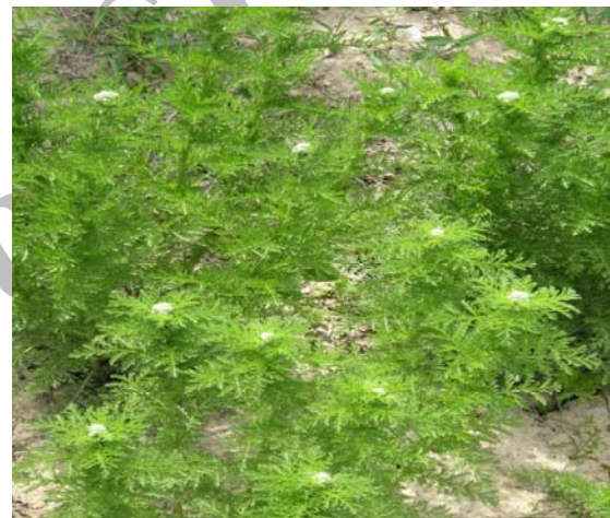
(شکل ۵) - A. nobilis در مرحله قبل از گلدهی

رشد این گیاه در شرایط آب و هوایی مشهد و ارزیابی فاکتورهای زینتی (طول دوره گلدهی، قطر گل آذین، ارتفاع گل آذین، تعداد ساقه گلدهنده، تعداد گل آذین‌های جانبی و ارتفاع بوته در مرحله گلدهی) در صورت طبقه بندی اولویت این گونه ها، ترتیب زیر پیشنهاد می‌شود.