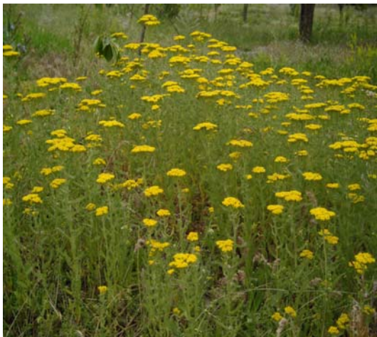
(شکل ۶) - A. biebersteini در مرحله گلدهی