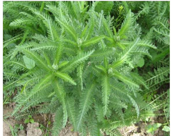
(شکل ۳) - A. millefolium در مرحله ساقه دهی