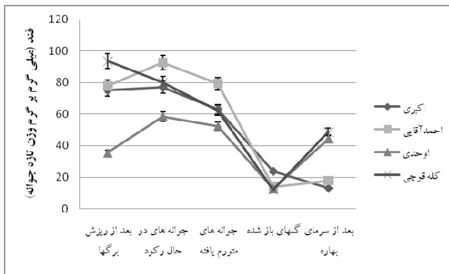
نمودار ۳- تغییرات مقدار قند در طی مراحل فنولوژی رشد گیاه

افزایش چشمگیری در طول فصل نشان می دهد. بنابراین در جمع بندی کلی می توان چنین استنباط کرد که رقم اکبری و رقم اوحدی مقاومت به سرمای خود را بترتیب حداقل مدیون تجمع قند و اسیدآمینة پرولین باشد. همچنین استعمال خارجی این اسیدآمینة پرولین نیز در مواردی پاسخ های مثبتی به افزایش مقاومت در مقابل یخ زدگی را نشان داده است (۳).