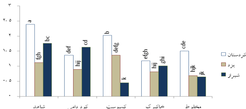
شکل ۳- تأثیر متقابل بستر کشت و اکوتیپ بر درصد پاراسیمن مرزه تابستانه

نتایج نشان داد که بیشترین درصد پاراسیمن (۱/۷۶) متعلق به تیمار شاهد بود و همه بسترهای آلی باعث کاهش معنی‌دار این ترکیب اسانس شدند. در مطالعه حاضر میزان ترکیب پاراسیمن نسبت به سایر آزمایشات انجام شده روی مرزه تابستانه کمتر بود (شکل ۳). طبق گزارشات جهان و کوچکی (۱۷)، میزان کامازولن موجود در گل‌های بابونه عکس‌العمل متفاوتی را نسبت به سطوح کود دامی نشان داد، بطوری که میزان این ماده در شرایط عدم مصرف کود دامی به طور معنی‌داری بیشتر از تیمارهای مصرف کود بود و بین سطوح