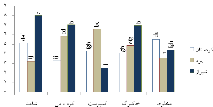
شکل ۲- تأثیر متقابل بستر کشت و اکوتیپ بر درصد گاماترپین مرزه تابستانه

نتایج این تحقیق حاکی از آن است که همه بسترهای آلی بر میزان این ماده اثر منفی داشتند بطوریکه کاهش این ترکیب اسانس در بستر مخلوط و بستر کمپوست زباله شهری معنی‌دار بود. امر و همکاران (۸) اعلام کردند که مصرف کودهای آلی هیچ تاثیری بر ترکیبات اسانس گیاه دارویی مرزنجوش ندارد، هنداوای و همکاران (۱۵) در آزمایشی، عدم تاثیر ناشی از کاربرد کمپوست و تاثیر منفی ناشی از کاربرد کود دامی بر درصد گاماترپین اسانس را گزارش کردند.