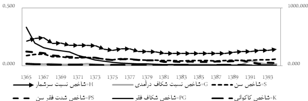
شکل ۲- تغییرات شاخص‌های کلاسیک فقر در مناطق روستایی ایران طی دوره ۱۳۶۵-۹۴ Figure 2- Changes of classical poverty indicators in rural areas of Iran during 1986-2015