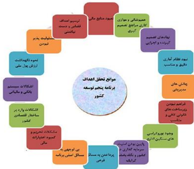
شکل ۲- موانع تحقق اهداف برنامه پنجم توسعه ایران

در برنامه پنجم توسعه برخلاف اعداد گزارش شده هیچ اقدامی در جهت افزایش سهم تعاونی‌ها در برنامه‌ریزی بلندمدت و بودجه سالانه صورت نگرفت و با آن وضع نتوانستند به اهداف مورد نظر دست یابند. با توجه به آن که اقتصاد مقاومتی به‌معنای حضور مردم در اقتصاد است و بهترین و والاترین اقتصاد مردمی، تعاونی است، برای پررنگ شدن