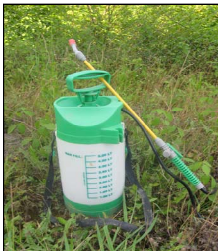
شکل ۲- باران ساز پمپی (راست) و کرت مورد استفاده (چپ) در تحقیق

کاربرد آزمون چند عاملی برای حذف خطای ناشی از تفاوت تکرار بین تیمارها و در ماه‌های مختلف به جز بهمن و آذر و دی و به ترتیب برای روان‌آب و رسوب در جدول ۳ نشان داده شده است. نتایج آماری جدول ۴ نیز حاکی از معنی‌دار بودن تغییرات حجم روان‌آب تحت تأثیر تیمار تندى شیب است. به عبارتی با افزایش شیب از کم به زیاد حجم روان‌آب کاهش یافته و این روند در هر دو دامنه مشاهده شده است. یافته‌های آغاسی و همکاران (۱۲) و آزلاین و بن-هور (۱۴) با تأکید بر هدررفت بیش‌تر خاک در شیب‌های کم به سبب ایجاد لایه نفوذناپذیر در آن‌ها مطابقت دارد. زیاد بودن خلل و فرج خاک تحت تأثیر کاهش وزن مخصوص ظاهری خاک (جدول ۱) رابطه معکوس با حجم روان‌آب دارد (۸). اگرچه می‌توان افزایش خلل و فرج خاک در شیب‌های زیاد را نیز به درصد بالاتر مواد آلی در این شیب‌ها نسبت داد (۳ و ۲۴).