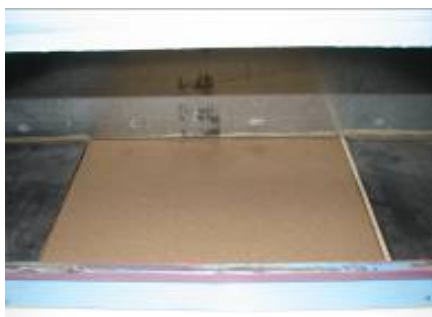
نمونه استقرار یافته در تونل قبل از شروع آزمایش

۱: غیر خمیری، ۲: ماسه بد دانه بندی شده (دانه بندی یکنواخت)، ۳: سیلت با خمیرایی کم، ۴: رس با خمیرایی کم