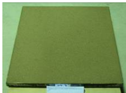
نمونه آزمایشی آماده شده