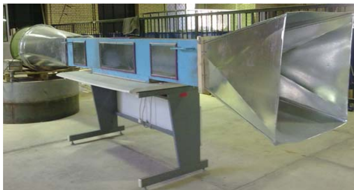
شکل ۱- تونل بادی ساخته شده به ترتیب از راست به چپ: تبدیل، تونل باد و پنجره های جانبی آن، پخش کننده و فن