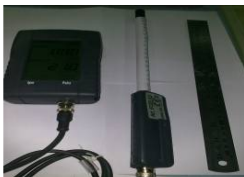
بادسنج فیلم داغ