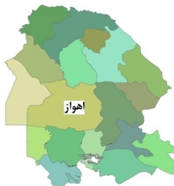
شکل ۱- محدوده مورد مطالعه (شهرستان اهواز) در استان خوزستان

برای تحقیق حاضر شهرستان اهواز واقع در استان خوزستان به عنوان منطقه مورد مطالعه انتخاب گردید (شکل ۱). این منطقه از نظر اقلیمی جزء مناطق خشک و نیمه خشک با تابستان‌های بسیار گرم است. موقعیت جغرافیایی ۴۰°، ۴۸° طول شرقی و ۲۰°، ۳۱° عرض شمالی و ارتفاع ۲۲/۵ متر از سطح دریا می‌باشد. میانگین پارامترهای هواشناسی در طول فصل زراعی گندم در جدول ۱ ارائه شده است.