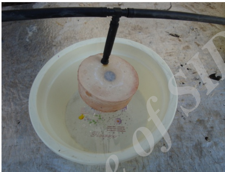
شکل ۱-نمایی از ظروف کوزه‌ای با جنس گل سلولزی

تیمار تراوا، به مسیر انتقال آب متصل شدند. ظروف کوزه‌ای از جنس گل رس سلولزی و به شکل استوانه با قطر ۱۵ سانتیمتر، ارتفاع پنجسانتیمتر، ضخامت حدود نیمسانتیمتر و سطح تراوش حدود ۸۹۰ سانتیمترمربع بوده است. با توجه به نتایج بررسی تعدادی از گسیلنده‌ها که در محدوده فشارهای ثقلی قابلیت کاربرد دارند (۷)، از گسیلنده‌های ثقلی مدل GDI در این تحقیق استفاده شد. لوله‌های تراوای مورد استفاده در این تحقیق نیز از نمونه لوله‌های ۱۶ میلیمتر وارداتی شرکت آناهیتا تامین شد.