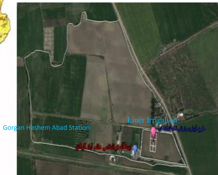
شکل ۱- موقعیت منطقه مورد مطالعه Figure 1- Location of study area