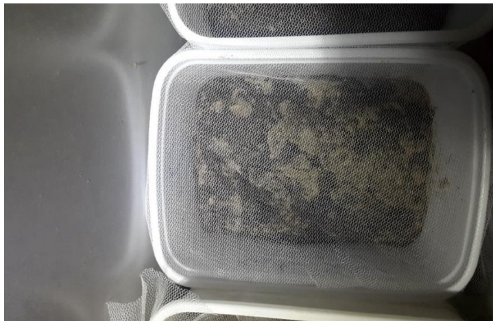
شکل ۲- آماده سازی راکتورها جهت انجام فرایند ورمی کمپوست