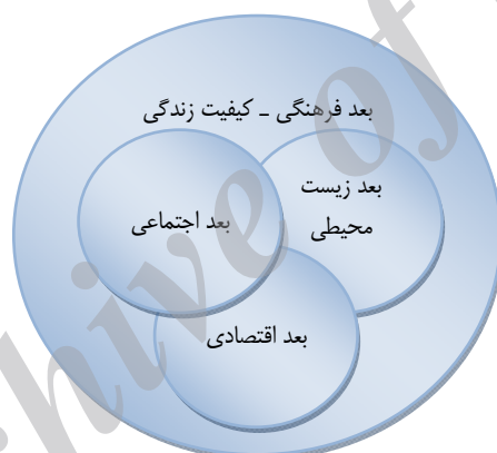
شکل ۱. مدل چهاررکنی پایداری (Runnalls, 2006)

نکته کلیدی در پایداری اجتماعی پرورش مشارکت، مبادله و احترام بین جریان‌های دولت، کسب و کار و نهادهای هنری است. فرهنگ این مشارکت‌ها را رشد می‌دهد و به سرعت نقش خود را در سیاست‌گذاری‌ها و برنامه‌ریزی‌ها در کانادا، استرالیا، زلاند نو و اروپا تقویت می‌کند.