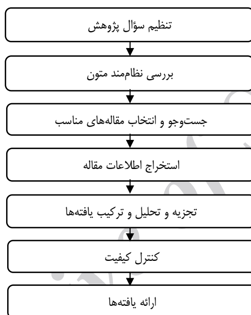
شکل ۱. مراحل هفت‌گانه پژوهش

فراترکیب با فراهم کردن نگرشی نظام‌مند برای پژوهشگران از طریق ترکیب پژوهش‌های کیفی مختلف به کشف موضوعات و استعاره‌های جدید و اساسی می‌پردازد و با این روش، دانش جاری را ارتقا می‌دهد و دید جامع و گسترده‌ای را به مسائل به وجود می‌آورد. فراترکیب مستلزم این است که پژوهشگر بازنگری دقیق و عمیقی انجام دهد و یافته‌های پژوهش‌های کیفی مرتبط را ترکیب کند (شهبازی سلطانی و صلواتیان، ۱۳۹۶). در این پژوهش از روش هفت مرحله‌ای فراترکیب سندلوسکی و بارسو ۱ (۲۰۰۷) استفاده شده که در شکل ۱، نشان داده شده است.