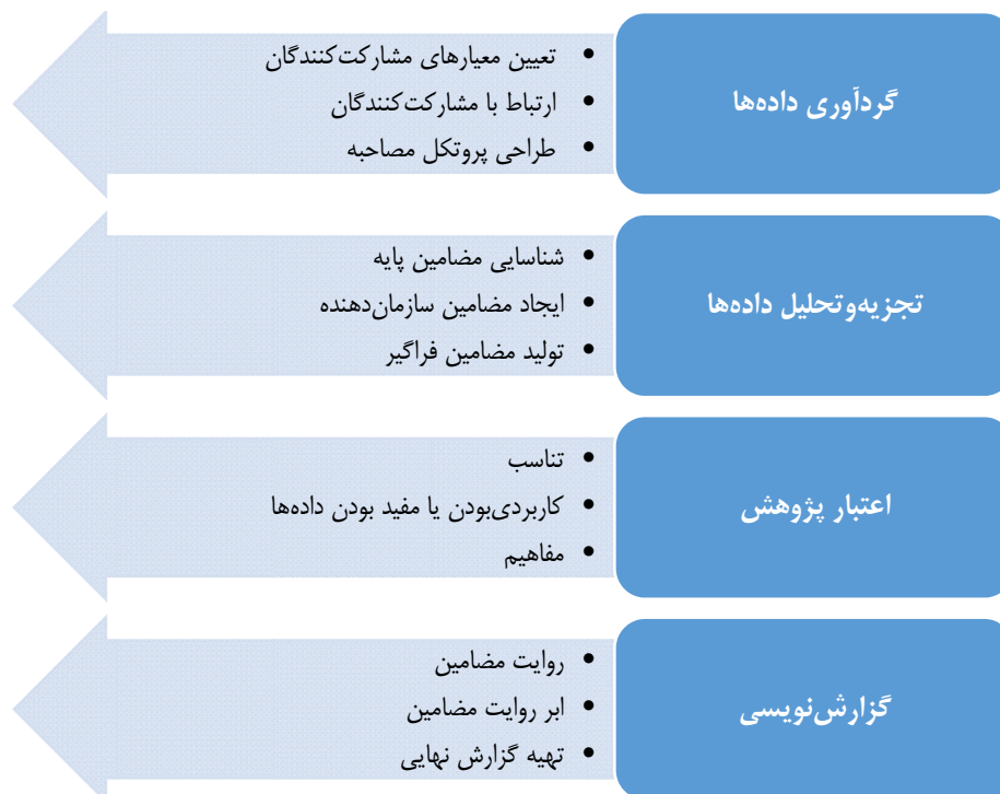
شکل ۱. مراحل اجرای پژوهش

پس از جمع‌آوری داده‌های پژوهش و به منظور تجزیه و تحلیل آن‌ها بر اساس یافته‌های استرلینگ (۲۰۰۱) داده‌ها در سه مرحله کدگذاری شدند: ۱. ابتدا مضمون‌های پایه در مرحله اول کدگذاری احصا شدند؛ ۲. در مرحله دوم کدگذاری، خروجی نهایی این مرحله مضمون‌های سازمان‌دهنده بودند؛ ۳. در مرحله آخر نیز مجموعه‌ای از مضمون‌های سازمان‌دهنده احصا شده در یک طبقه قرار گرفتند و تشکیل مضمون‌های فراگیر را دادند (استرلینگ، ۲۰۰۱). پس از انجام کدگذاری و به منظور توصیف مضمون‌های اصلی شناسایی شده، تصمیم بر آن شد تا این کار با استفاده از روش براون و کلارک ۱ (۲۰۰۶) انجام شود. در نهایت نیز ارتباط بین مضمون‌های احصا شده با استفاده از روش استرلینگ ۲ (۲۰۰۱) بررسی شد. سایر مراحل تجزیه و تحلیل داده‌های پژوهش بدین صورت است: ۱. روایت ۳ مضامین احصا شده؛ ۲. ابر روایت ۴ مضامین فراگیر شناسایی شده؛ ۳. تهیه گزارش نهایی یافته‌های پژوهش. شایان ذکر است که در پژوهش حاضر از ترکیبی از روش‌های استرلینگ (۲۰۰۱) و براون و کلارک (۲۰۰۶) بهره گرفته شد (بودلایی، مهدیرجی، شمسی، جعفری صادقی و گارسیا پرز، ۲۰۲۰). برای کسب اطمینان از اعتبار پژوهش حاضر سه شاخص تناسب، کاربردی بودن یا مفید بودن یافته‌ها و مفاهیم که توسط کوربین و اشتراوس (۱۹۹۸) ارائه شده است، مورد استفاده قرار گرفته است. مراحل اجرای پژوهش حاضر در نمودار زیر نشان داده شده است.