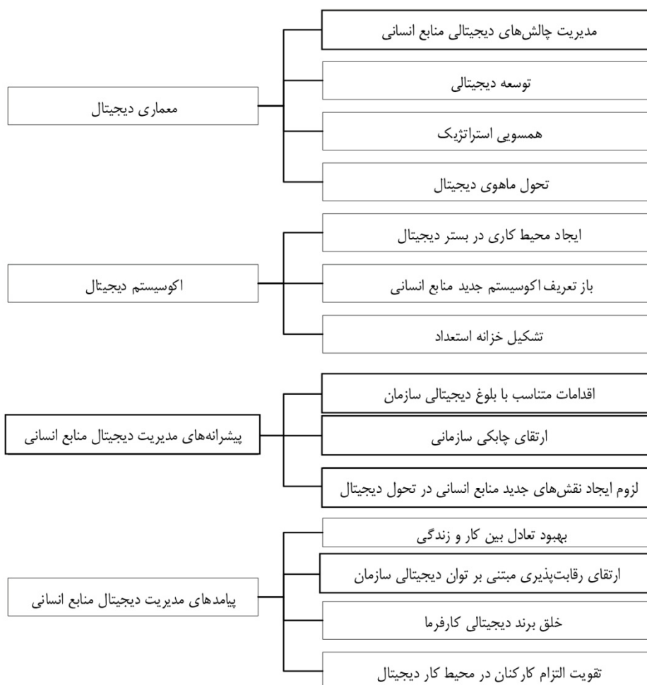
شکل ۲. مدل شماتیک مضامین فراگیر و سازمان‌دهنده پژوهش

نشان داد که ویژگی‌های دیجیتال‌سازی در عصر چابکی می‌تواند متفاوت باشد؛ زیرا هر سازمان فرهنگ، استراتژی و اهداف خاص خود را دارد. مدیران بخش دولتی بسیاری از موارد مشترک را دنبال می‌کنند اصول و روش‌های مشابه را اتخاذ می‌کنند. سیستم‌های جدید متخصصان منابع انسانی را قادر ساخته تا خدمات بهتری برای ذینفعان سازمان خود فراهم کنند، مدیریت دیجیتال منابع انسانی بهترین مصداق این نوع از سیستم‌هاست، که کاربرد آن به یک ضرورت تبدیل شده است. البته این سیستم در ایران با مسائلی روبروست؛ از طرفی تبیین مناسبی از مفهوم نشده است، از طرفی به علت بی‌توجهی به عوامل مؤثر بر استقرار آن با مشکلاتی مواجه شده است. به همین منظور نیاز بود تا مدلی طراحی شود تا بتواند نیازهای شبکه بانکی بخش دولتی را برطرف کند. شایان ذکر است که مدل شماتیک نهایی مضامین فراگیر و سازمان‌دهنده شناسایی شده در پژوهش حاضر نیز در شکل زیر نشان داده شده است.