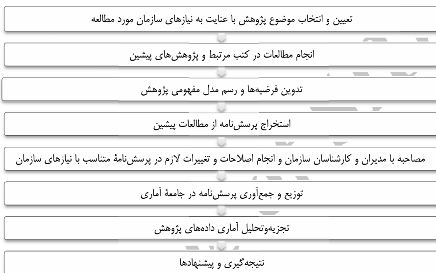
شکل ۲. مراحل انجام پژوهش

تعیین میزان پایایی پرسش‌نامه، از ضریب آلفای کرونباخ استفاده شد که مقدار آن 0/904 به دست آمد و با توجه به اینکه مقدار به دست آمده بیشتر از 0/70 است، در نتیجه پایایی پرسش‌نامه نیز تأیید می‌شود. از تعداد ۱۰۵ پرسش‌نامه توزیع شده میان متخصصان و کارشناسان منطقه ۳ عملیات انتقال گاز ایران که در حوزه کاری مرتبط با پروژه‌ها فعالیت می‌کنند، تعداد ۸۰ پرسش‌نامه (۷۶ درصد) جمع‌آوری شد. خلاصه‌ای از مراحل انجام پژوهش در شکل ۲ نشان داده شده است.