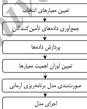
شکل ۱. فرایند پژوهش

مطابق شکل ۱، برای اجرای پژوهش حاضر گام‌های زیر طی شده است.