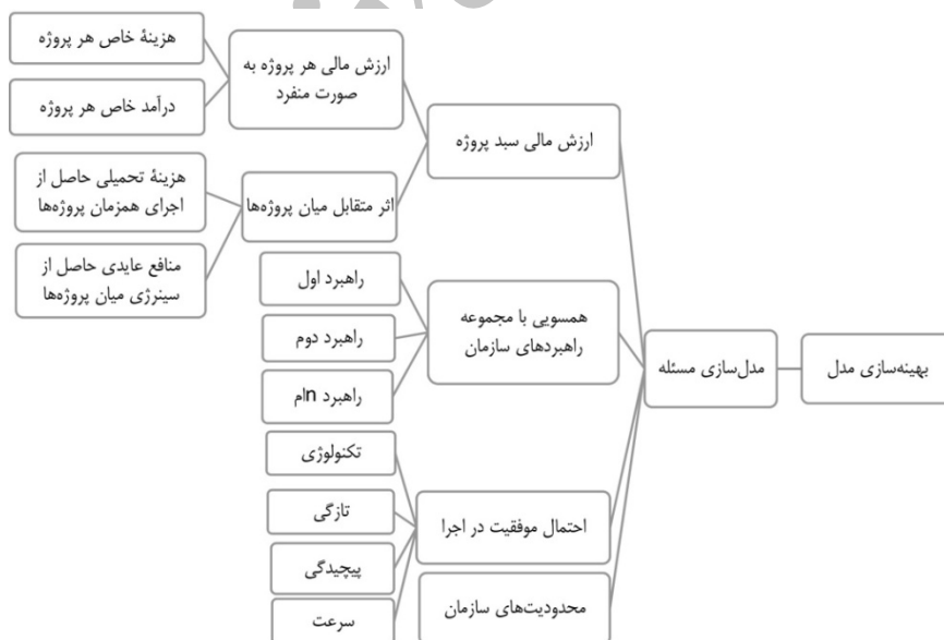
شکل ۱. مدل مفهومی

مسئله انتخاب و بهینه‌سازی سبد پروژه به‌طور کلی به‌دنبال انتخاب مجموعه مناسب و محدودی از پروژه‌های پیشنهادی است، به طوری که ضمن تأمین اهداف چندگانه سازمان بر محدودیت‌های موجود فائق آید. در این مقاله سعی شده با ادغام معیارها و اهداف اصلی ارائه‌شده توسط کوپر و ایجت (۲۰۰۸) و شنهار، دویر، لوی و مالتز (۲۰۰۱) مسئله انتخاب سبد پروژه مدل‌سازی و سپس با استفاده از الگوریتم خود بهینه‌سازی مبتنی بر آموزش و یادگیری بهینه‌سازی شود.