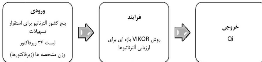
شکل ۲. فاز دوم روش از دیدگاه سیستماتیک