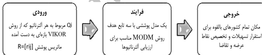
شکل ۳. فاز سوم روش از دیدگاه سیستماتیک بازه‌ای

تابع هدف اول تضمین می‌کند حداقل تعداد کارخانه تأسیس شده است. تابع هدف دوم با کمیته‌سازی مقدار Q_i که در مرحله قبل از روش ویکور بازه‌ای به دست آمد، مطلوبیت کشورهای بالقوه را برای استقرار تسهیلات بیشینه می‌کند. تابع هدف سوم به کمیته‌سازی هزینه حمل‌ونقل در تخصیص کشورهای حمایت‌کننده ( i ) و کشورهای حمایت‌شونده ( z ) می‌پردازد. در این تابع هدف، عدد ۲۰ ضریب هزینه ثابت حمل‌ونقل میان هر مبدأ و مقصد است. محدودیت اول برای این است اگر مبدأ i وجود داشته باشد و این مبدأ در تخصیص‌های صورت‌گرفته انتخاب نشود، مقصدی نیز برای این مبدأ وجود نخواهد داشت؛ بنابراین، متغیر تخصیص به آن صفر در نظر گرفته می‌شود. محدودیت دوم برای این است که به‌ازای هر مقصد یک مبدأ در نظر گرفته شود. محدودیت سوم مربوط به رعایت شعاع پوشش در انتخاب مسیر است. در این محدودیت A = [a_{ij}] ، ماتریس پوشش نامیده می‌شود. محدودیت چهارم مربوط به رعایت ظرفیت عرضه مبدأهاست و اینکه مجموع تقاضای مقصدها از مجموع عرضه مبدأها بیشتر نباشد.