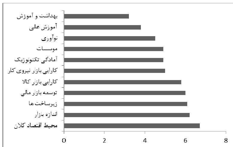
شکل ۴. میانگین رتبه‌های فاکتورهای اصلی