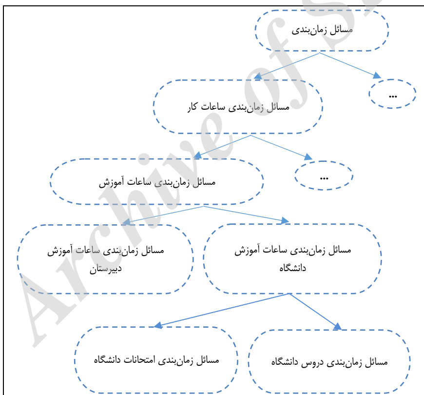
شکل ۱. دیاگرام جایگاه مسئله زمان‌بندی دروس دانشگاهی

اوبیت (۲۰۱۰)، روسی دوربا و همکارانش (۲۰۰۲)، سرینی واسان، سینف و کومار (۲۰۱۱) و بابایی، کریم پور و حدیدی (۲۰۱۵) اشاره کرد. در پژوهش‌های داخلی نیز مسئله زمان‌بندی دروس دانشگاهی در کانون توجه و تحقیق بوده است. در این پژوهش‌ها از تکنیک‌های مدل‌سازی ریاضی (اسماعیلیان و عبداللهی، ۱۳۹۵؛ علیرضایی، منصورزاده و خلیلی، ۱۳۸۵؛ راستگار امینی و میرمحمدی، ۱۳۹۱) و الگوریتم‌های فراابتکاری (منجمی، مسعودیان، استکی و نعمت‌بخش، ۱۳۸۸؛ جودکی، منتظری و موسوی، ۱۳۹۰؛ بهداد، دهقانی و ذاکر تولایی، ۱۳۸۵؛ سلیمی فر و بابایی‌زاده، ۱۳۹۰؛ فراهانی و زندیه، ۱۳۹۲) برای حل این مسئله استفاده شده است. جایگاه مسئله زمان‌بندی دروس دانشگاهی در بین مسائل زمان‌بندی و حالت‌های مختلف آن در شکل ۱ نشان داده شده است (بابایی، کریم‌پور و حدیدی، ۲۰۱۵).