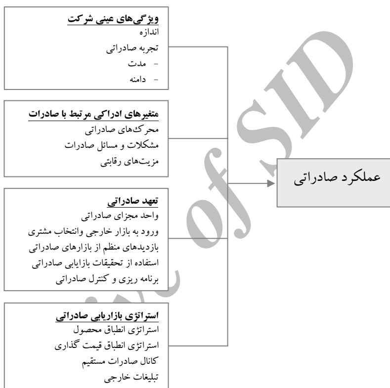
نمودار ۲. مدل مفهومی

است (عوامل کششی). محرک‌های انفعالی، در ارتباط با عکس العمل شرکت‌ها به تغییرات شرایط و بازتاب‌کننده گرایش منفعل در جستجوی فرصت‌های صادراتی است (عوامل فشاری). چون این دو نوع محرک، بازتاب‌کننده الگوهای متفاوت از رفتار و گرایش صادراتی است، که عملکرد صادراتی را در جهت‌های متفاوت تحت تأثیر قرار می‌دهند، لذا تصمیم‌گیری صادراتی همزمان با عناصر اثرگذار و انفعالی، درگیر است.