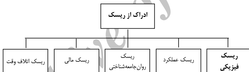
نمودار ۱. ابعاد ادراک ریسک

شرکت ملی پخش فرآورده‌های نفتی ایران با طراحی و اجرای پروژه سامانه هوشمند سوخت در تیرماه ۱۳۸۶، یکی از بزرگ‌ترین پروژه‌های IT در سطح جهان را راه‌اندازی کرد. این سامانه امکان پرداخت الکترونیکی بهای سوخت را برای صاحبان خودروها فراهم کرده است. موضوع پژوهش حاضر درباره‌ی ادراک ریسک صاحبان خودرو در خصوص پرداخت الکترونیکی بهای سوخت است. یکی از رویکردهای بازاریابی در بانکداری مدرن، رویکرد دیدگاه و ارزش درک‌شده مشتری می‌باشد. در این راستا مبحث شناسایی ادراک از ریسک در استفاده از خدمات الکترونیکی شایان توجه و بررسی است (حسینی، احمدی نژاد و فارسی زاده، ۱۳۹۱). در این پژوهش ریسک به معنای انتظار ذهنی زیان یا پیامدهای منفی در رفتار خرید و یا استفاده از یک محصول مطرح می‌شود و برای تعیین میزان اهمیت ابعاد ادراک ریسک صاحبان خودرو، از روش تحلیل محتوا (تکنیک آنتروپی شانون) و در چارچوب مدل ترکیبی ادراک از ریسک پیتر و تارپی ۱ (نمودار شماره ۱) استفاده شده است.