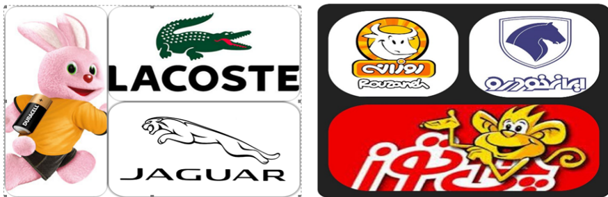
شکل ۲. مسکات‌های مطالعه شده در پژوهش

با توجه به توضیحات ذکر شده، مطالعه ما بر نمادهای حیوانی موجود در ۶ برند (داخلی و خارجی) شامل میمونک چی توز، گاو روزانه، اسب در ایران خودرو، خرگوش باطری دوارسل، پلنگ جگوار و سوسمار لاگوست، انجام شده است که تصاویر این مسکات‌ها را در شکل ۲ مشاهده می‌کنید.