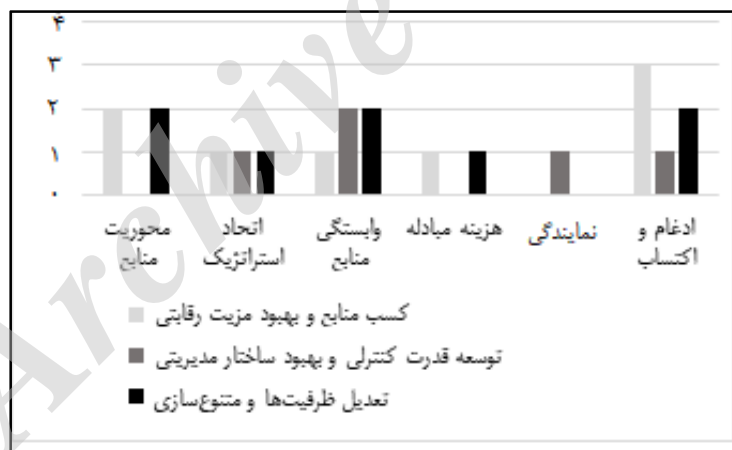
شکل ۱. وضعیت مضامین اشاره‌شده در نظریه‌های همکاری کسب و کار

نظریه هزینه مبادله بر شرایط عدم اطمینان در بازار اشاره دارد و بدین ترتیب یکپارچه‌سازی عمودی را ضروری برای دستیابی به هدف حداقل‌سازی هزینه‌ها می‌داند. در این نظریه به سلسله مراتب سازمان و یکپارچه‌سازی عمودی به‌صورت توأم در شرایط عدم اطمینان توجه شده است. در واقع، شناخت سلسله مراتب بازار می‌تواند هماهنگی لازم برای کاهش هزینه‌ها را در پی داشته باشد. محتوای این نظریه در مرتبه نخست بر کاهش بدهی‌ها و هزینه‌های شرکت اشاره دارد و در مرتبه دوم کاهش عدم اطمینان و تعدیل ظرفیت‌ها را در دستور کار قرار داده است.