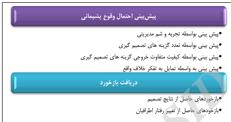
شکل ۲. تم‌های اصلی و فرعی مرتبط با توصیفات شناختی مشارکت‌کنندگان از پدیده پشیمانی استراتژیک

مد نظر بهترین تصمیم ممکن نبوده و می‌توانستید در گذشته بهتر عمل کنید؟» پدیدار می‌شود. همان‌طور که مشاهده می‌شود این تجربیات به صورت کلی در قالب دو تم اصلی و شش تم فرعی به شرح ذیل دسته‌بندی شده است.