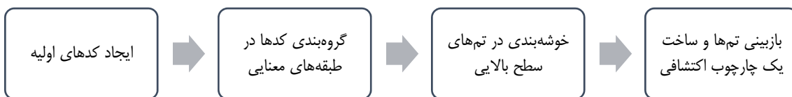
شکل ۱. مراحل اجرای تحلیل تم

برای تحلیل داده‌ها و تدوین مدل ذهنی مدیران از موانع و محرک‌های صادرات از تحلیل تم با استفاده از نرم‌افزار Maxqda استفاده شده است. طی فرایند تحلیل، از روش مقایسه مداوم ۲ برای کدگذاری متون استفاده شده و کدگذاری داده‌ها نیز بر مبنای رویکرد استقرای انجام شده است. در رویکرد استقرایی، نظریه‌ای از قبل در ذهن وجود ندارد و کدها از دل داده‌ها استخراج می‌شوند. در این پژوهش، تحلیل تم بر اساس الگوی ارائه‌شده توسط ویلیگ ۳ (۲۰۱۳)، به شرح شکل ۱ اجرا شده است.