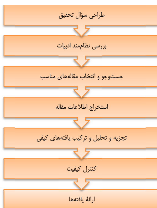
شکل ۱. گام‌های روش فراترکیب

تفسیر داده‌های اصلی مطالعات منتخب است. در روش فراترکیب شش گام اصلی وجود دارد که عبارت‌اند از: تنظیم سؤال تحقیق، بررسی نظام‌مند ادبیات، جست‌وجو و انتخاب مقالات مناسب، استخراج اطلاعات از مقالات، تجزیه و تحلیل یافته‌های کیفی، کنترل کیفیت و ارائه یافته‌ها. در ادامه این بخش، هرگام به‌صورت جداگانه تشریح شده و کاربرد آن در موضوع تحقیق حاضر که بررسی و گروه‌بندی عوامل مؤثر بر موفقیت بازاریابی و بررسی است، بیان می‌شود. شکل ۱ گام-های فراترکیب را به نمایش گذاشته است.