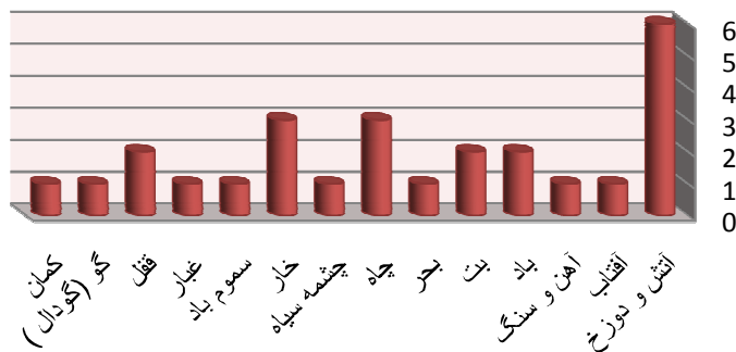
نمودار ستونی (۲): بسامد تمثیلات عناصر اربعه و جمادات در مفهوم نفس اماره در حکایات‌های سه دفتر اول

در این قسمت نیز چند مثال از جدول شماره (۲) را به اختصار ذکر می‌کنیم: ۱-۲- آتش و دوزخ: مولانا با بهره گرفتن از تصویرهای مجازی، اضافه تشبیهی و تشبیه اسنادی، نفس اماره را در سیری ناپذیر بودن به دوزخ مانند می‌کند. به طور کلی، وی دوزخ را تجسم نفس انسان می‌داند و می‌گوید: