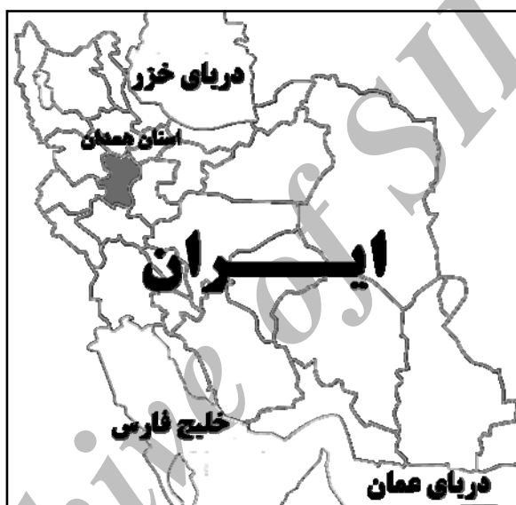
شکل ۲. موقعیت استان همدان در غرب کشور

دو روستای ورکانه و شهرستانه، در استان همدان و در دامنه رشته‌کوه زاگرس قرار گرفته‌اند. دلیل انتخاب این دو روستا برای انجام مطالعات موردی، وجود مشخصه‌های نسبتاً مشابه با کلیه روستاهای کوهپایه‌ای منطقه زاگرس بوده است (شکل‌های ۲ و ۳). در این مطالعه، در هریک از دو روستا، هشت عامل اصلی تأثیرگذار در شکل‌گیری منظر فرهنگی مورد توجه قرار گرفته و ارتباط آنها با فرهنگ و مدل زندگی روستاییان بررسی شده است. این عوامل که عبارت‌اند از اقلیم، آب، امنیت، نظام بهره‌برداری از زمین، ریخت‌شناسی (مورفولوژی) روستایی، مشاغل غالب مردم، طبیعت پیرامونی و سنت‌های اجتماعی، در جداول ۱ و ۲ ارائه گشته‌اند.