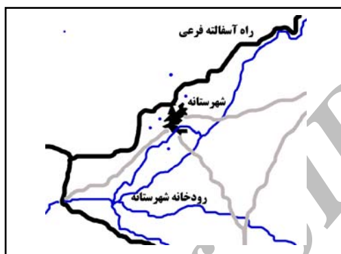
شکل ۷. موقعیت روستای شهرستانه، و راه‌های فرعی و روستایی و منابع طبیعی پیرامون

روستای شهرستانه در دره‌ای به همین نام واقع است (شکل ۷). دره شهرستانه از زمین‌های آبرفتی حوالی روستای اشتران آغاز می‌شود و در امتداد جاده قدیمی همدان به تویسرکان پس از گذر از چندین سکونتگاه روستایی در بلندترین ارتفاع منطقه به روستای شهرستانه ختم می‌گردد (بنیاد مسکن انقلاب اسلامی، ۱۳۸۶).