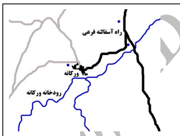
شکل ۴. موقعیت روستای ورکانه، با توجه به راه‌های فرعی و روستایی و منابع طبیعی پیرامون

روستای ورکانه در جنوب شرقی شهرستان همدان و در امتداد جاده فرعی منشعب از جاده همدان به ملایر قرار گرفته است (شکل ۴). این روستا به سبب بافت سنگی منحصر به فرد آن، در سال‌های اخیر مورد توجه قرار گرفته است. روستای مذکور همچنین به دلیل تلفیق هنرمندانه خانه‌ها، حیاط‌ها و باغ - خانه‌های سنگی با طبیعت پیرامون، دارای فضاهایی دلنشین و انسان‌مدار است (شکل ۵).