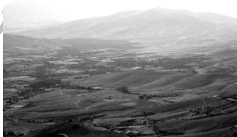
شکل ۸. دورنمای منظر متأثر از فرهنگ ساکنان (منظر فرهنگی) در روستای شهرستانه

شیارهای متعددی از دامنه‌های دره شهرستانه به عمق آن کشیده شده‌اند، که هریک دره‌ای سرسبز ایجاد کرده است. در دره شهرستانه، «خرم‌رود» جریان دارد و ارتفاعات بالادست مشرف به انتهای دره از زیستگاه‌های عمده پرنده‌گانی چون کبک محسوب می‌گردد (گروسین، ۱۳۸۳، ۱۲۳) (تصویر ۸). اهالی روستاهای دره شهرستانه عمدتاً به زراعت و باغداری می‌پردازند و خشکیار از جمله فرآورده‌های باغ‌های این دره است (بنیاد مسکن انقلاب اسلامی، ۱۳۸۶).