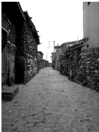
شکل ۶. معابر باریک و ساختمان‌های سنگی با سقف مسطح در بافت به هم فشرده روستای ورکانه.

براساس مشاهدات میدانی و بررسی نقشه‌ها و تصاویر ماهواره‌ای روستای ورکانه در طول دوره‌های مختلف زمانی، می‌توان مهم‌ترین عوامل مؤثر بر شکل‌گیری منظر فرهنگی در آن را در جدول ۱ طبقه‌بندی کرد و توصیفی کلی از آنها به دست داد (جدول ۱).