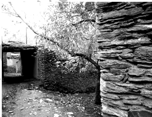
شکل ۵. تلفیق معماری و طبیعت در روستای ورکانه

این روستا به دلیل موقعیت جغرافیایی خاص آن، از دیرباز در انزوا قرار داشته است و تنها راه ارتباطی آن یک راه فرعی روستایی است. این انزوا گرچه محرومیت‌هایی را برای روستا به همراه داشته اما به اعتقاد نگارنده سبب حفظ فرم و فضای روستا به حالت سنتی خود شده است. به طور کلی در روستای ورکانه همچون دیگر روستاهای واقع در منطقه سردسیر زاگرس، به منظور استفاده از انرژی حرارتی ناشی از تابش آفتاب، پوشش سطوح خارجی تیره‌رنگ انتخاب گردیده و بافت روستا به هم فشرده است (قبادیان، ۱۳۸۳؛ عزیزی، ۱۳۷۵، ۲۸) (شکل ۶).