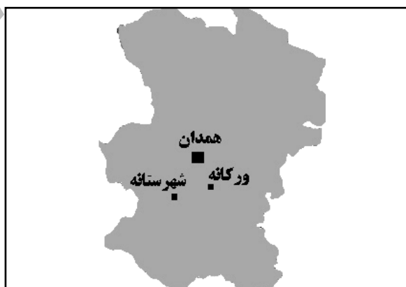
شکل ۳. موقعیت دو روستای ورکانه و شهرستانه در استان همدان