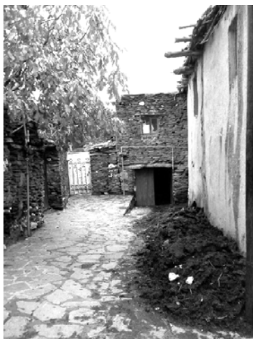
شکل ۹. شکل‌گیری منظر روستایی با مصالح بوم‌آورد به عنوان نشانه‌ای از تأثیر فرهنگ بر منظر