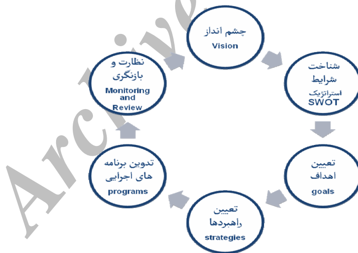
شکل ۲. مدل مفهومی پژوهش

شکل ۲ مدل مفهومی پژوهش را که بر مبنای برنامه‌ریزی راهبردی است، نشان می‌دهد: