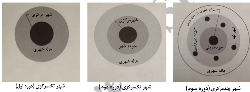
شکل ۱. تغییرات ریخت‌شناسی شهر

ج) دوره سوم از سال ۱۹۷۰ به بعد آغاز می‌گردد و نواحی کلان‌شهری چندمرکزی شکل می‌گیرند. گسترش هسته‌های جمعیتی و شهرک‌های اقماری در پیرامون شهر اصلی و دست‌اندازی توسعه شهری به نواحی پیرامونی از مشخصه‌های این دوره است (ن.ک. شکل ۱).