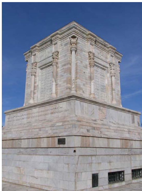
شکل ۲. مقبره حکیم ابوالقاسم فردوسی: نمادی از ایستادگی در احیای هویت ایرانی