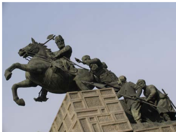
شکل ۳. تندیس نادر در مشهد مقدس: القاکننده حس هویت و نمادی از پایداری در حفظ میهن