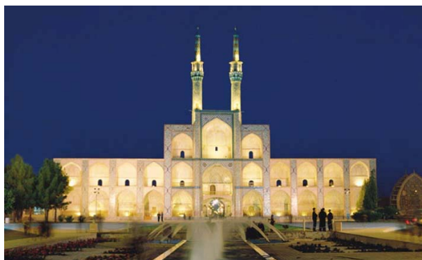
شکل ۵. تکیه امیر چخماق یزد: سامان دهنده حوزه خاص فرهنگی و نماد ارتباط اجتماعی